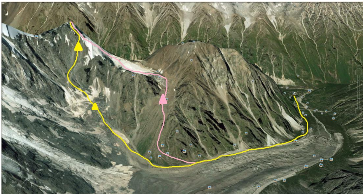
Рис.1. Общий вид района