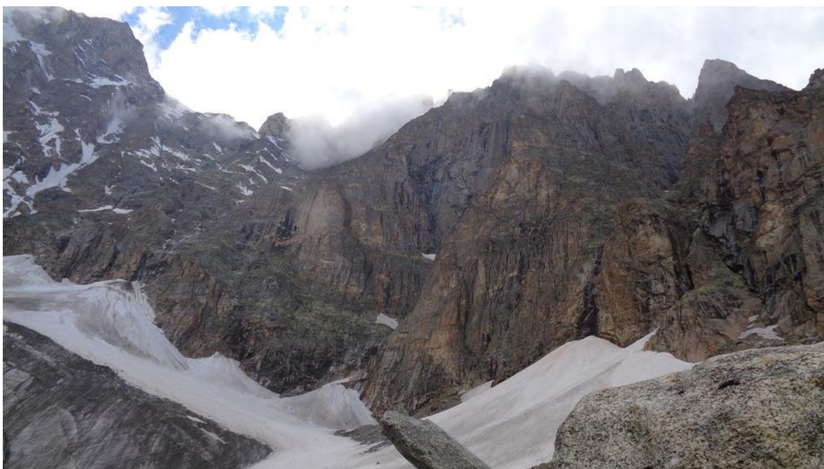
Рис.4. Техническое фото маршрута