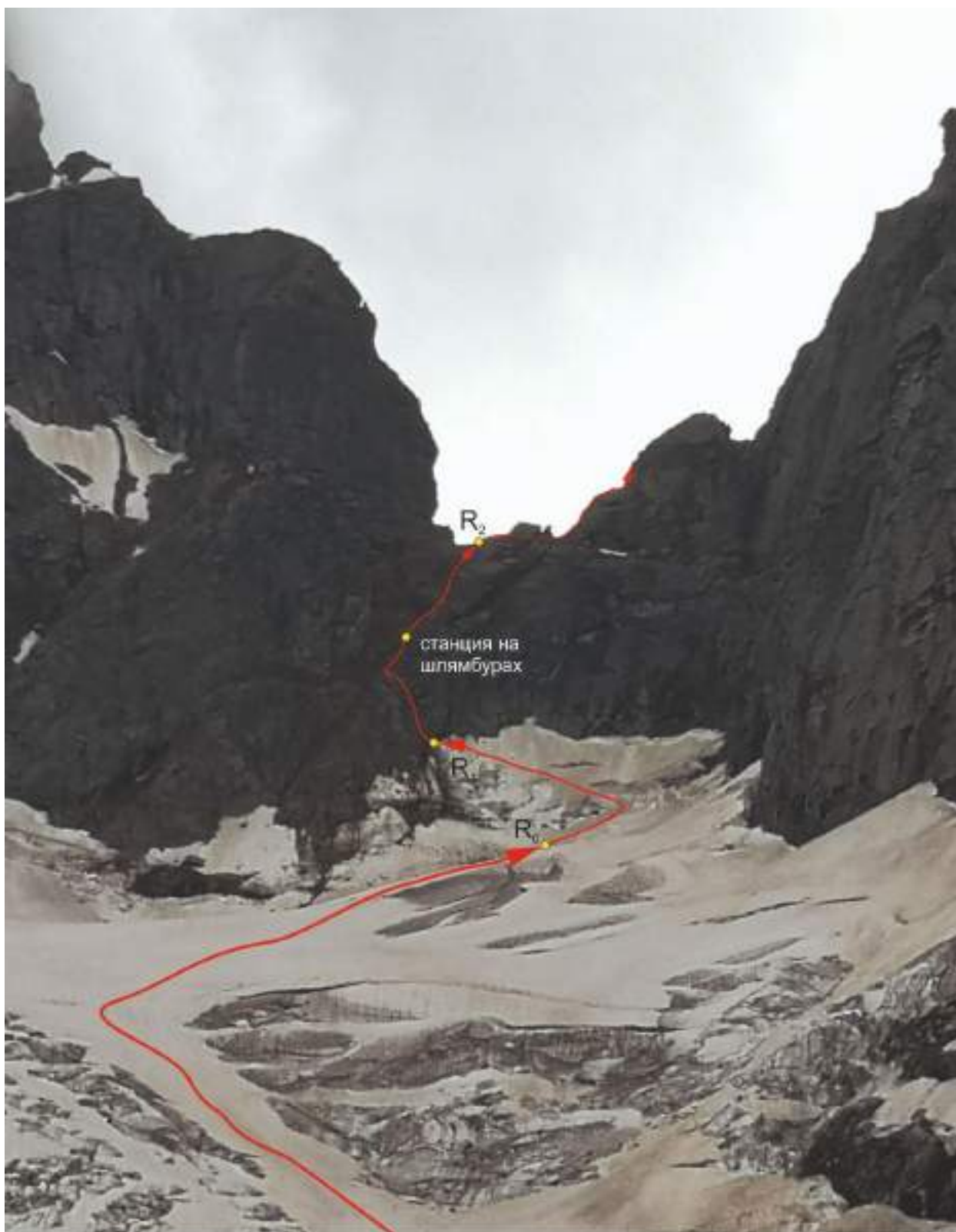
Фото 2. Линия подъема на перевал Двойняшки (участки R0-R1, R1-R2)

На участке R0-R1 при проходе бергшрунда и траверсе влево вкрутили несколько буров при одновременном движении. Станция R1 в удобном кармане между скалами и снегом закрыта от камней перед камнеопасным участком.