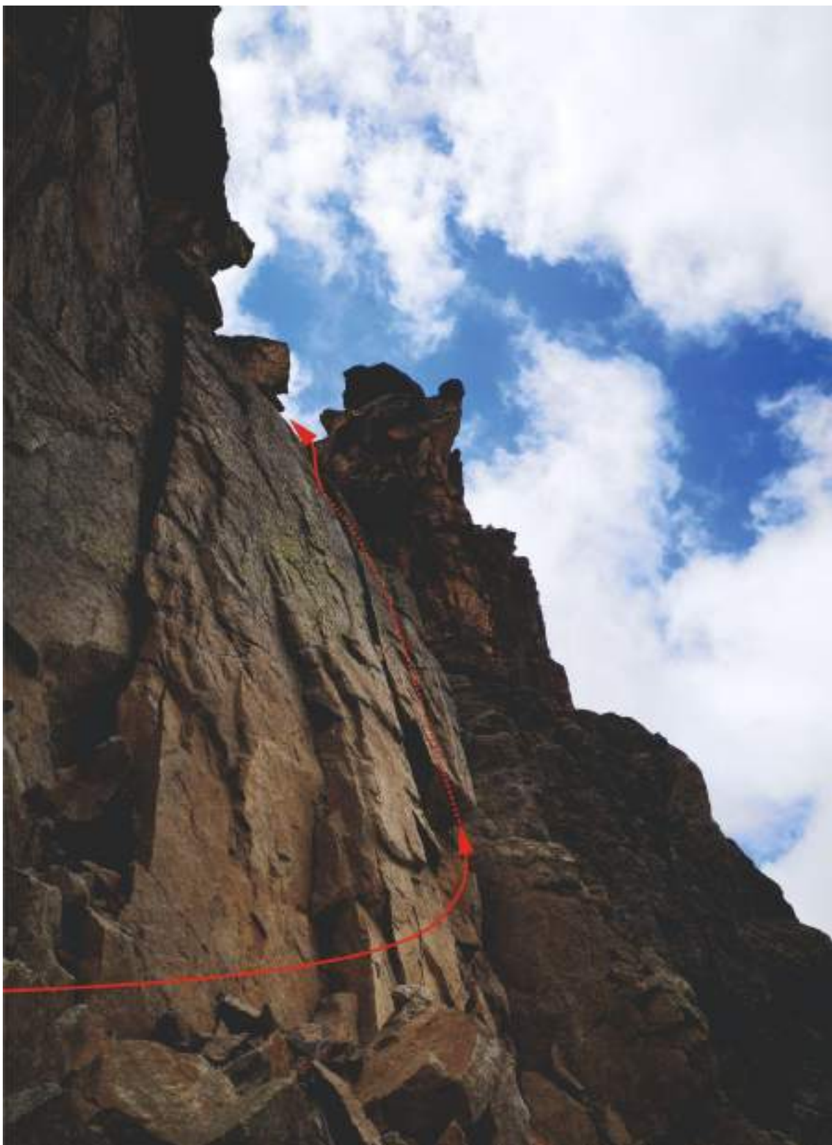
Продолжение приятного лазания.