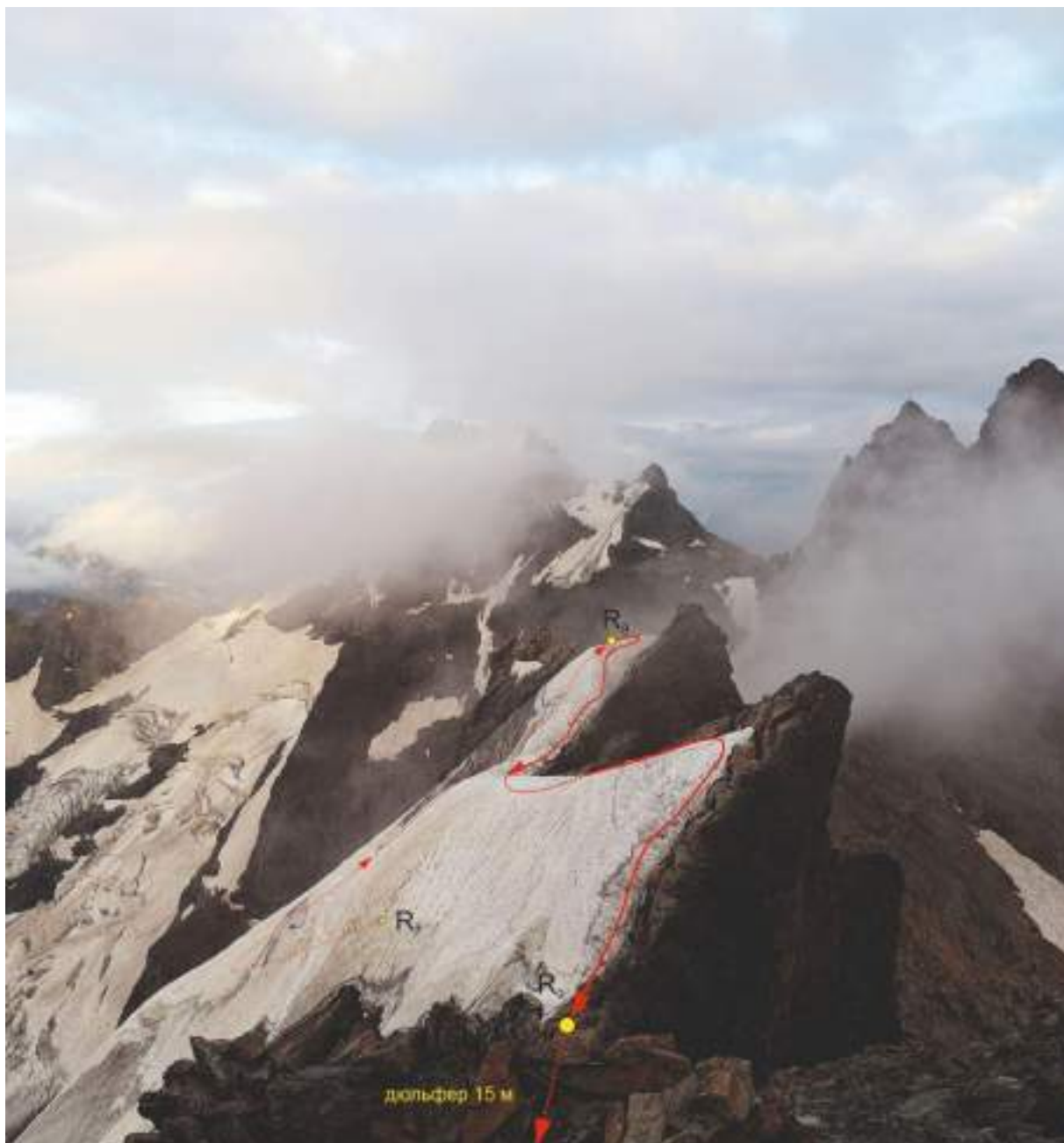
Фото 6. Линия движения на участках R7-R8, R8-R9 (после выхода на снежный нож после 40 м дюльфера)