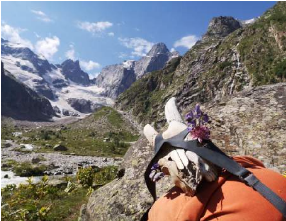
Фото 16. Команда спустилась в долину реки Кичкинекол