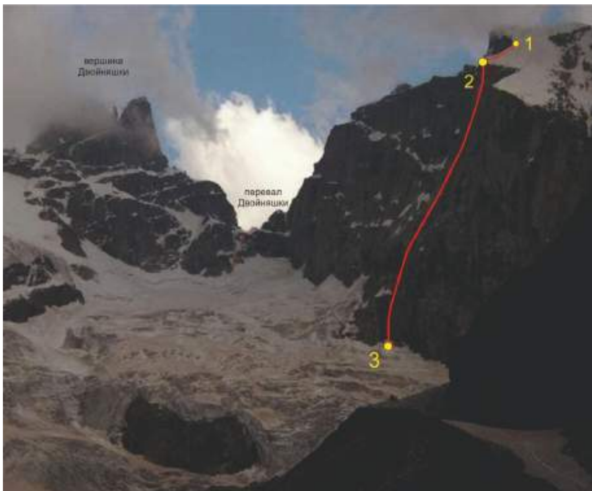
Фото 15. Спускové дюльфера после снежного ножа

Участок 1-2 - линия прохода от места спуска со снежного ножа к скалам (на маршруте это была точка R7) к точке 2, где находится первая спусковая станция на шлямбурах. От 1 к 2 шли пешком уже без кошек, снега было мало и вытаяла довольно широкая скальная полка прямо до начала дюльферов. Участок 2-3 - линия 18 роскошных дюльферов. Станции расположены по логичному пути, каждая следующая, в основном левее предыдущей (если находиться лицом к стене). На некоторых станциях зелёной краской есть стрелки, указывающие направление до следующей. В зависимости от степени вытаивания рельефа и наличия верёвки 60 м, возможно избежать 18-го дюльфера и спуститься сразу на снежный мост. На участке дюльферов есть вероятность спуска камней участниками по неосторожности.