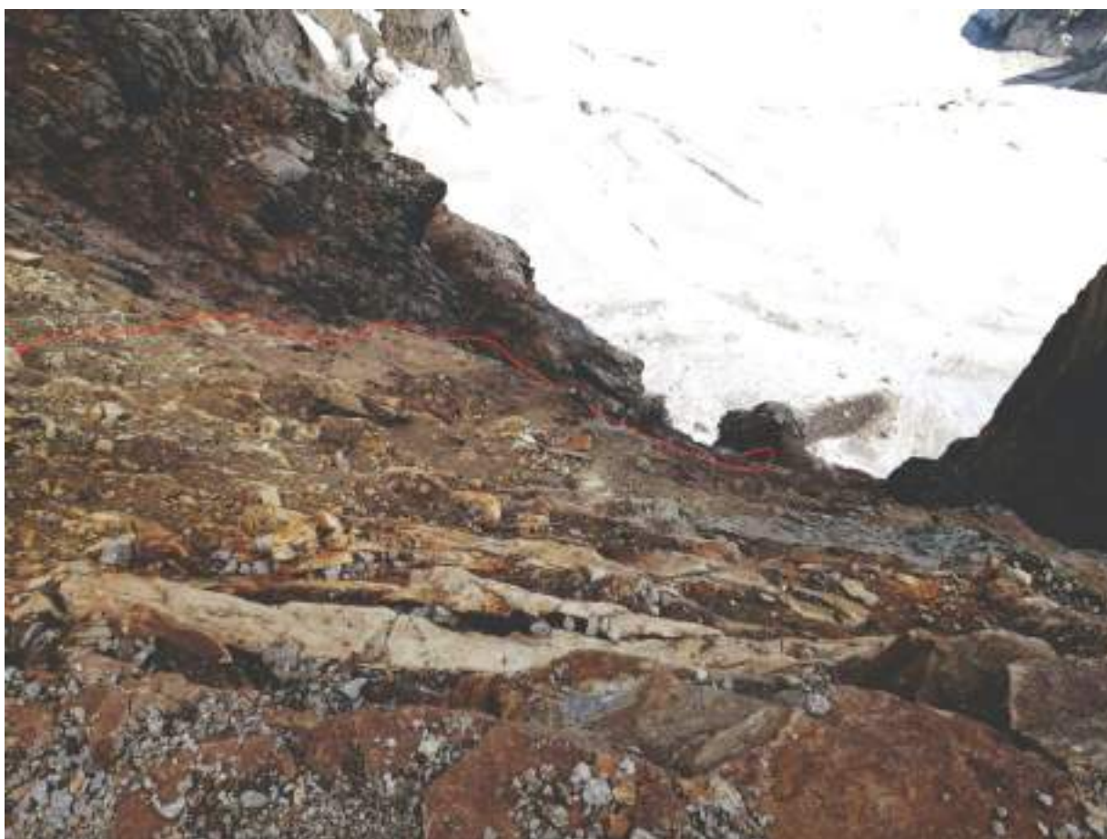
Фото 3. Вид на участка R1-R2 с перевала Двойняшки

Самый неприятный участок на маршруте. Надёжная страховка крайне затруднена, почти всё - вытянувшее “живьё” на рельефе под углом 45-70°. Велика вероятность перебить верёвки. Камнеопасно. На фото участник на подъёме после удобной безопасной станции на шлямбурах, про которую писали выше.