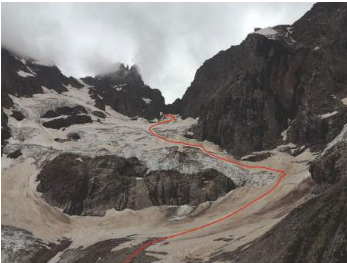
Фото 1. Путь подхода под маршрут и местоположение участка R0-R1

В нижней трети ледника, перед резким уходом влево под стеной Далара через весь язык проходит легкопреодолимая трещина с перепадом высот чуть более метра, далее все трещины обходятся.