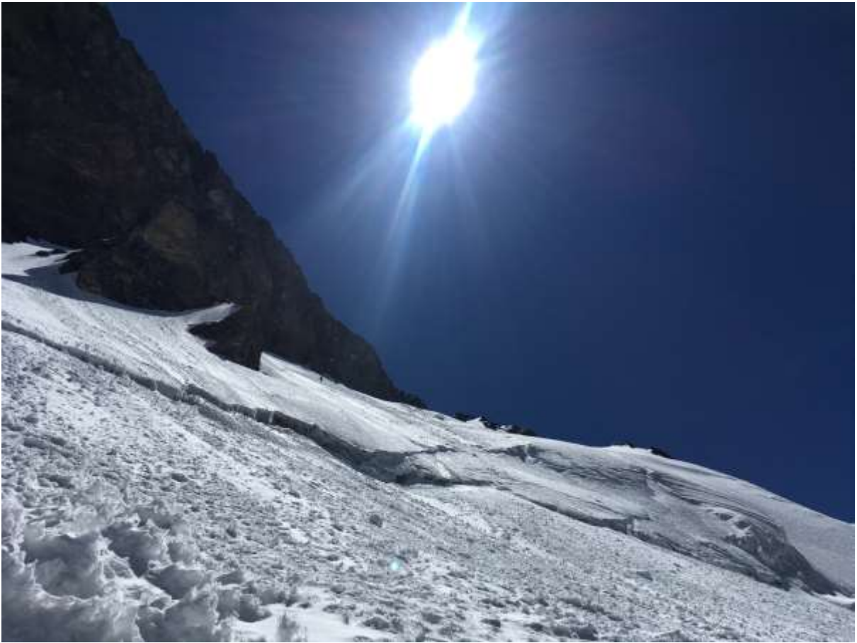
Рис.6. Подход под скалу «Парус» под западной стеной п. Корженевской