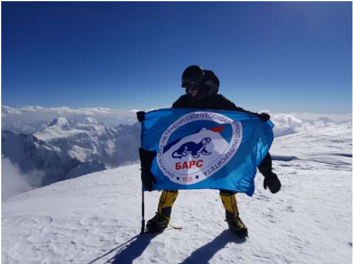
Рис.11. Вершина п. Корженевской (7105м) фото флага Альпклуба СПбГУ «БАРС» Федерации Альпинизма Санкт-Петербурга.