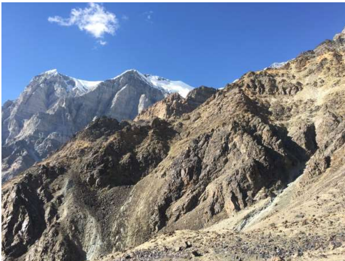
Рис.4. Подход под маршрут Пик Е. Корженевской (Цетлин)