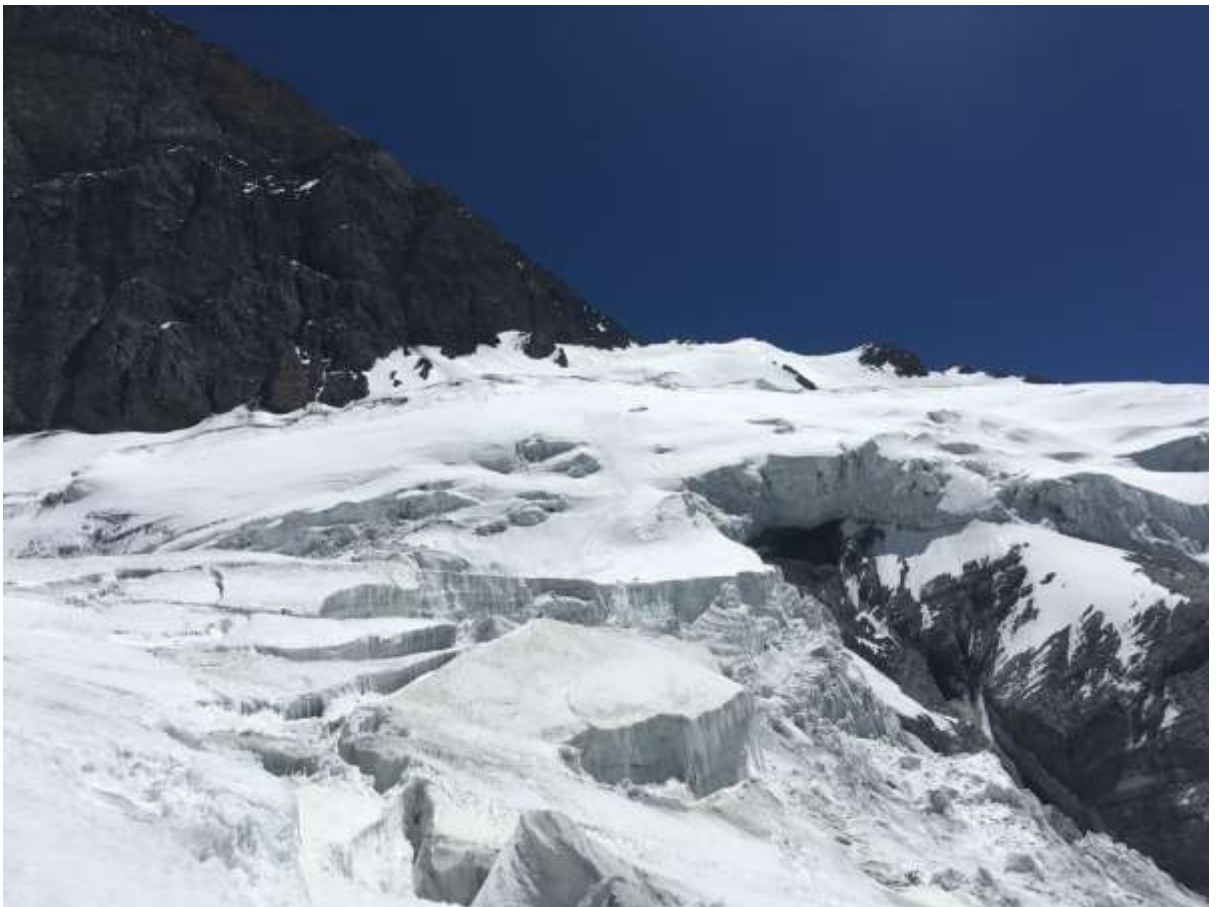
Рис.7. Вид на ледопад западной стены и южного ребра п. Корженевской