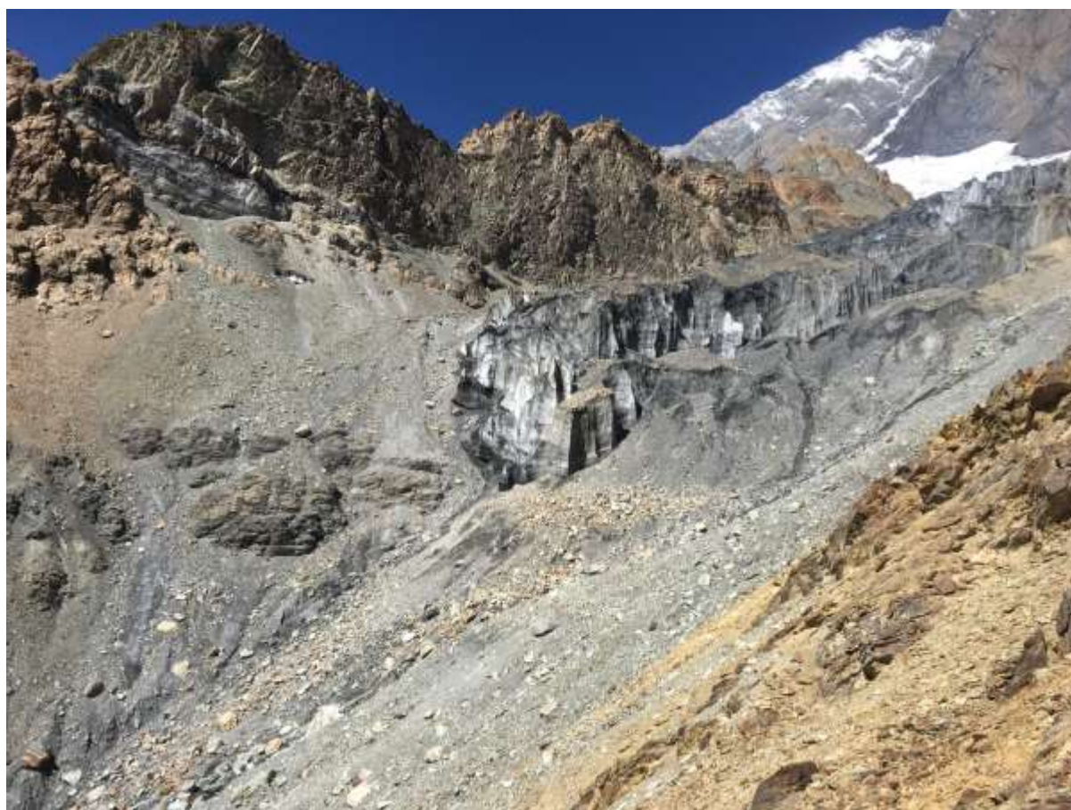
Рис.5. выход на язык ледника Пик Е. Корженевской западной стены