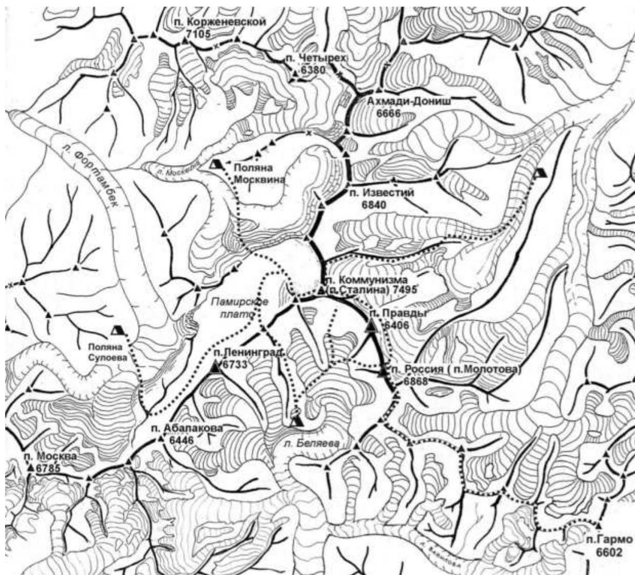
Рис.1. Карта-схема района.