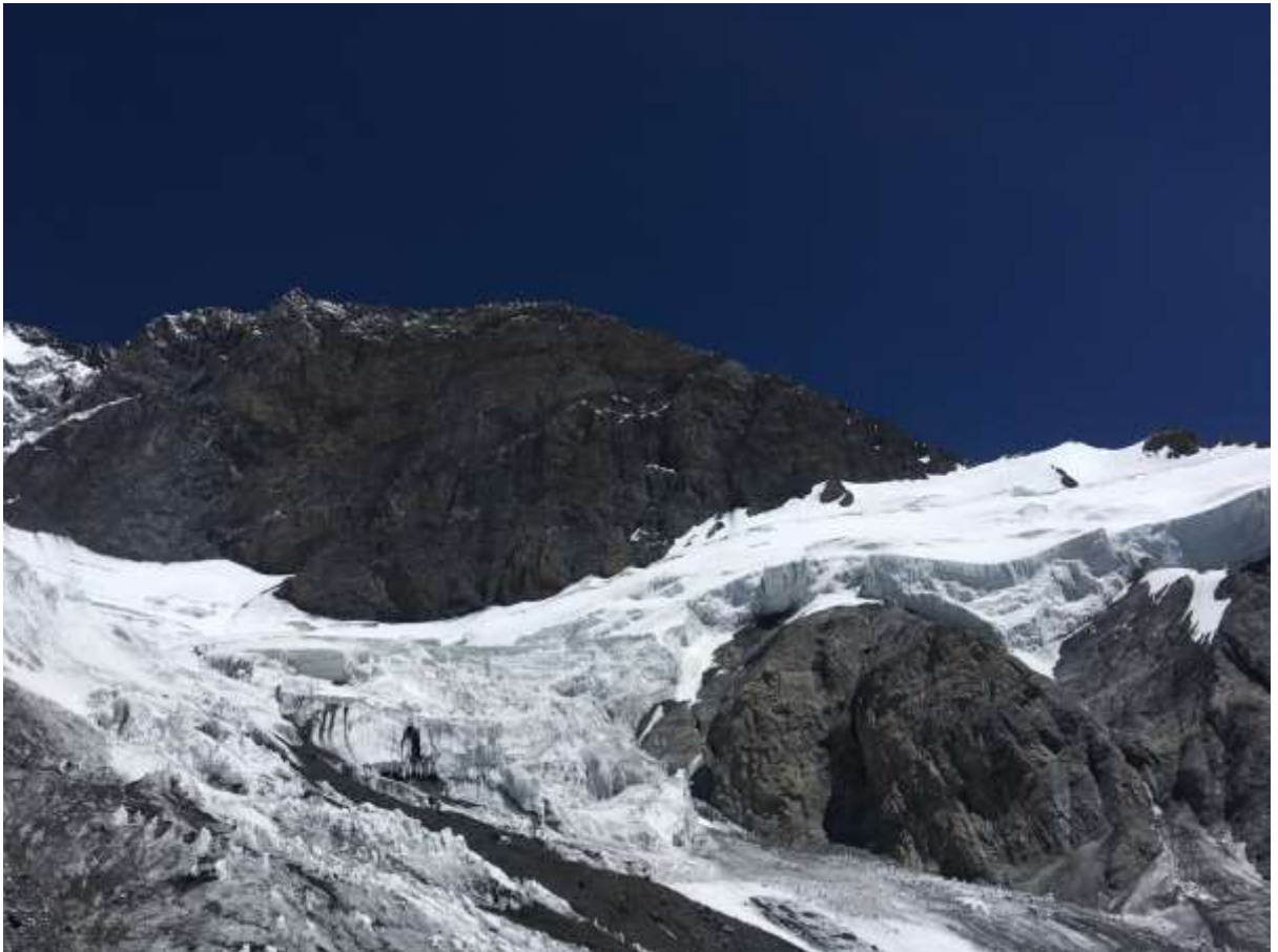
Рис.6. Вид на ледопад западной стены и южного ребра п. Корженевской