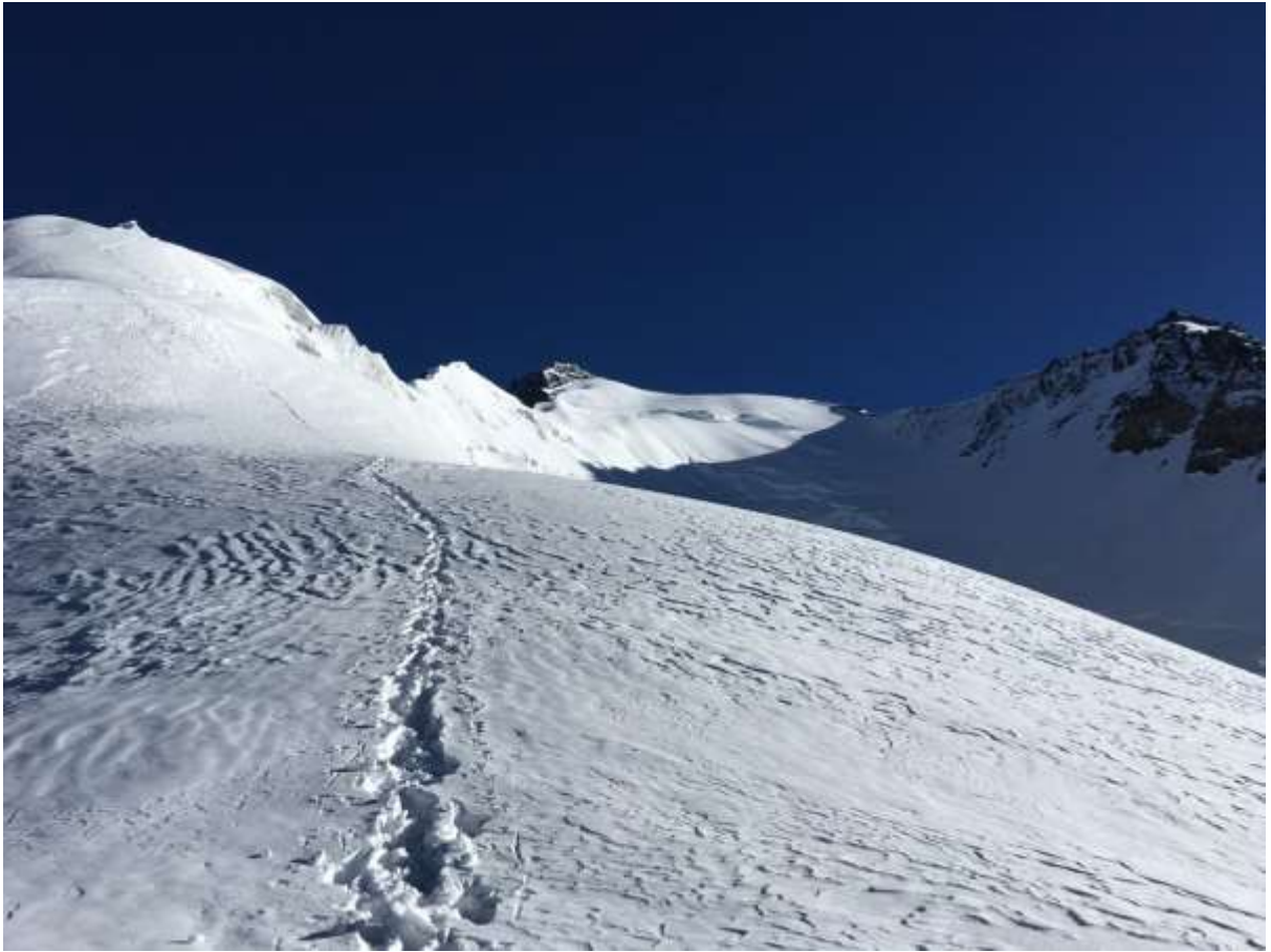
Рис.9. Вид на вершину п. Корженевской на следующий день после штурма с 6300 м.