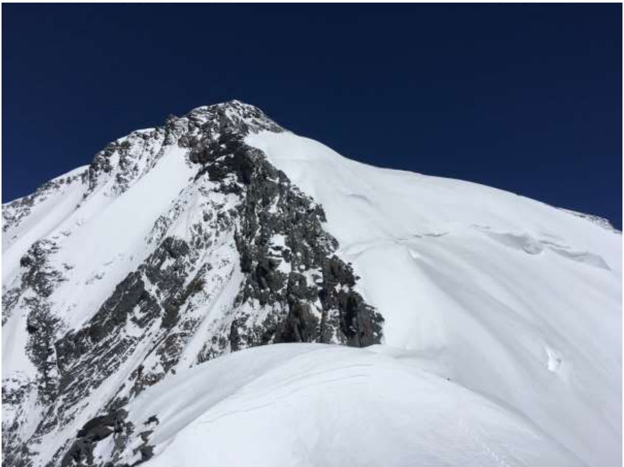
Рис.10. Вид на вершину с 6700 после верблюдов.