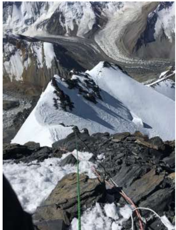
Рис.7 и 8. Южное ребро п. Корженевской 6100 м. снимки сделаны с низу и с верху скальной гряды.