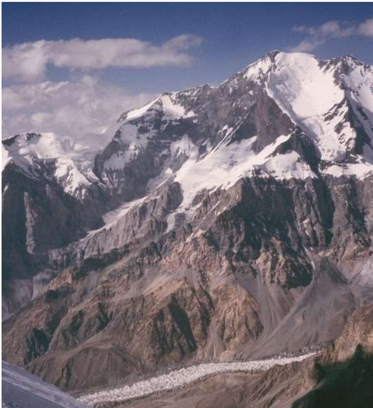
Рис.2. Нитка маршрута на Пик Е. Корженевской (маршрут Цетлина, 1966г)