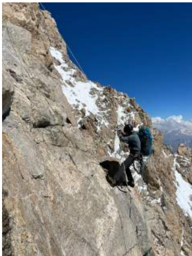
Рис. 8: Участок 7–8