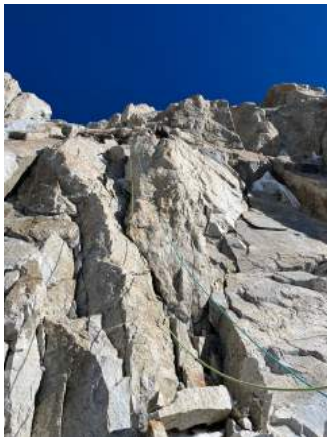
Рис. 7: Участок 3–4