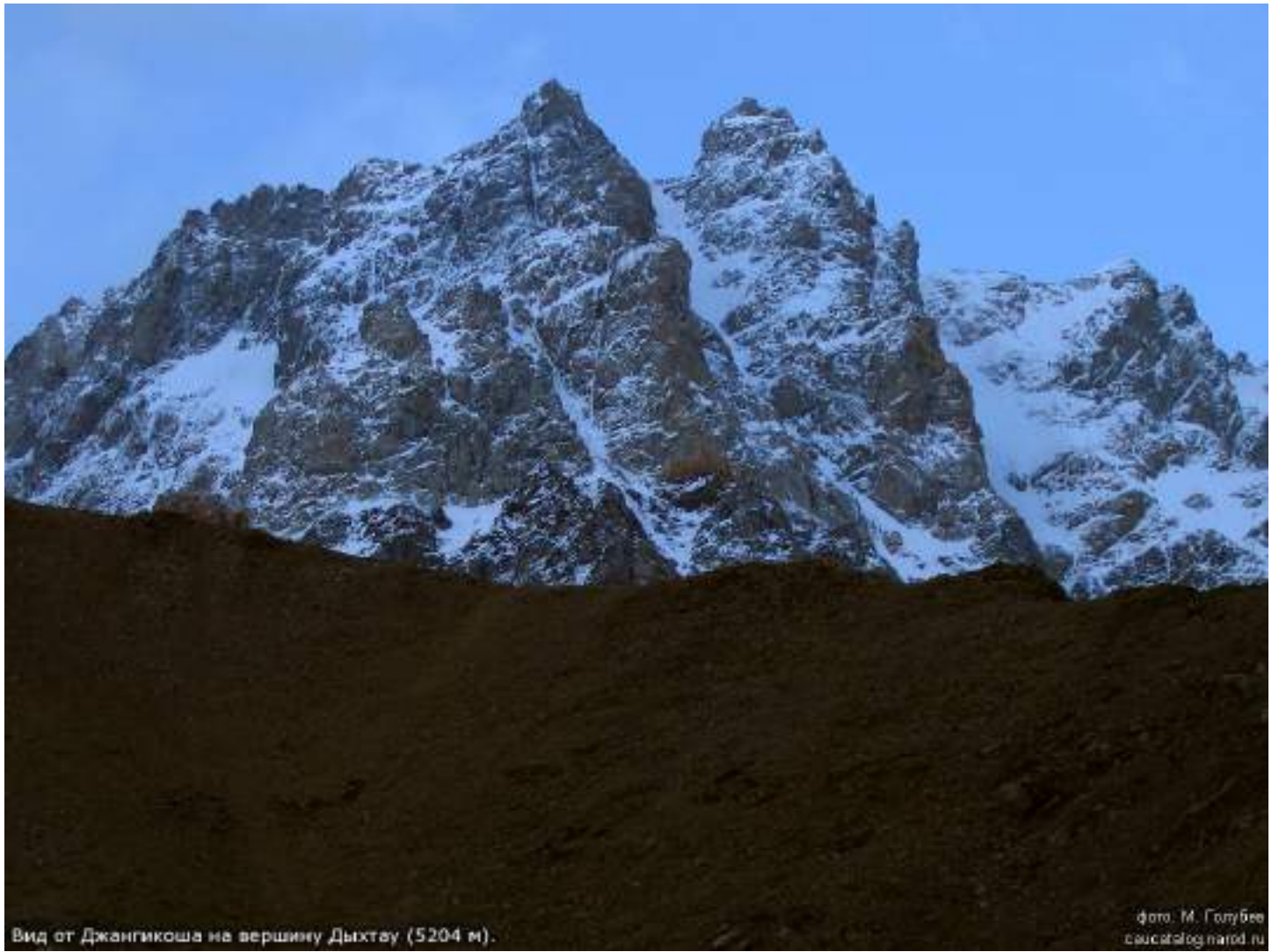
Рис. 2: Южные контрфорсы Дыхтау