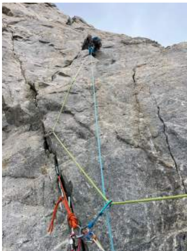
Рис. 11: Ключевой участок верхней части маршрута