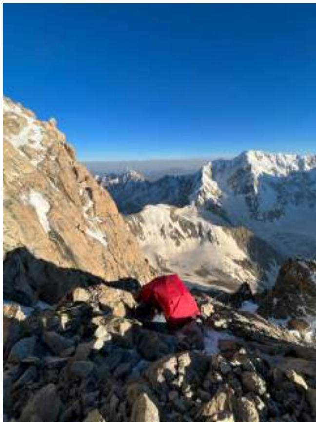
Рис. 9: Ночевка левее пятого жандарма