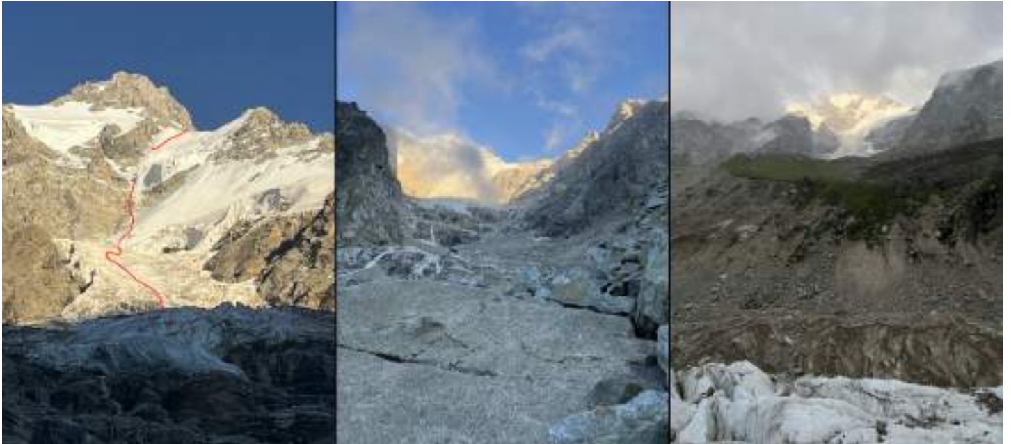
Рис. 13: Вид на верхнюю, среднюю и нижнюю части спуска