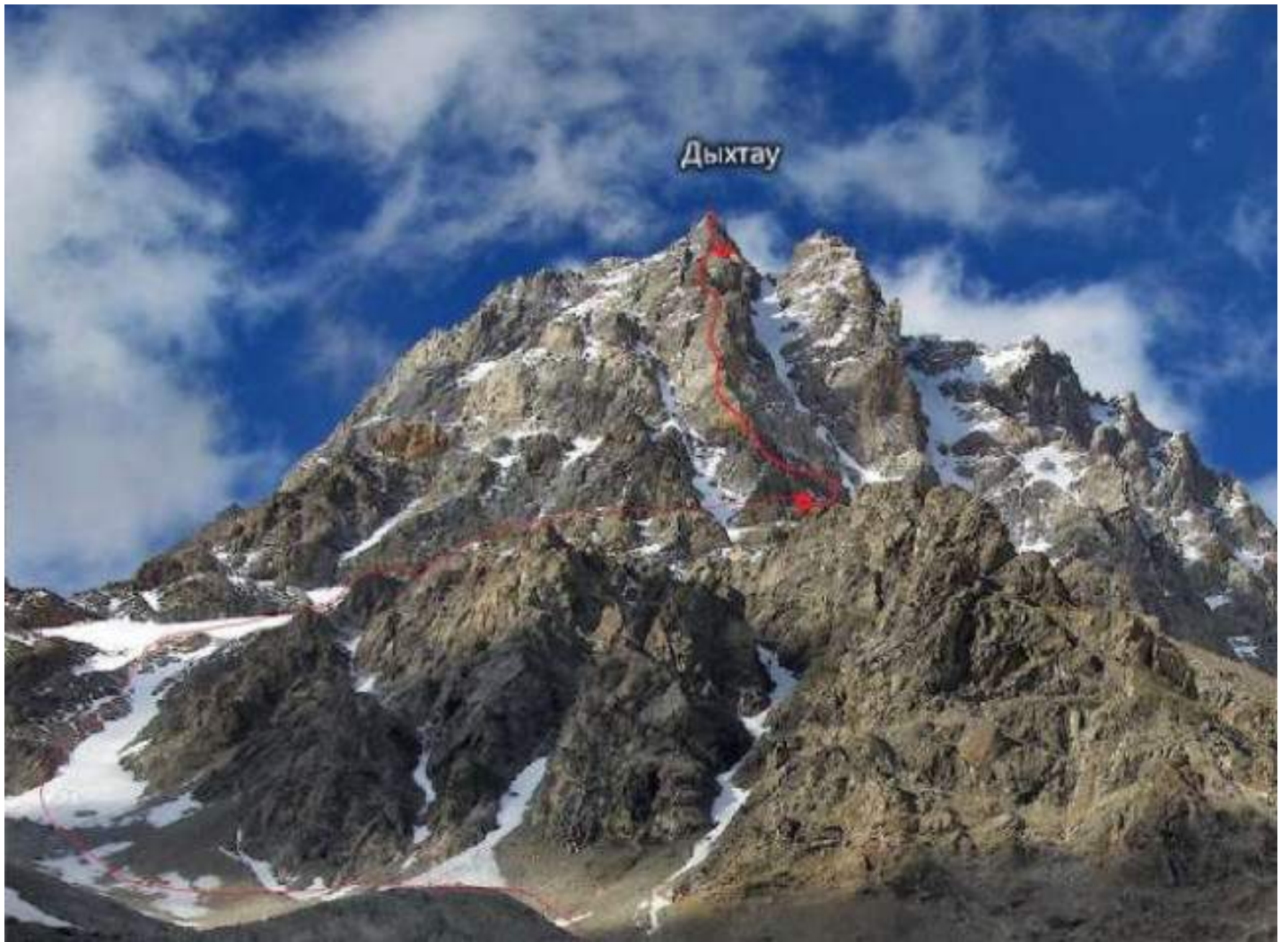
Рис. 4: Путь подъема на вершину