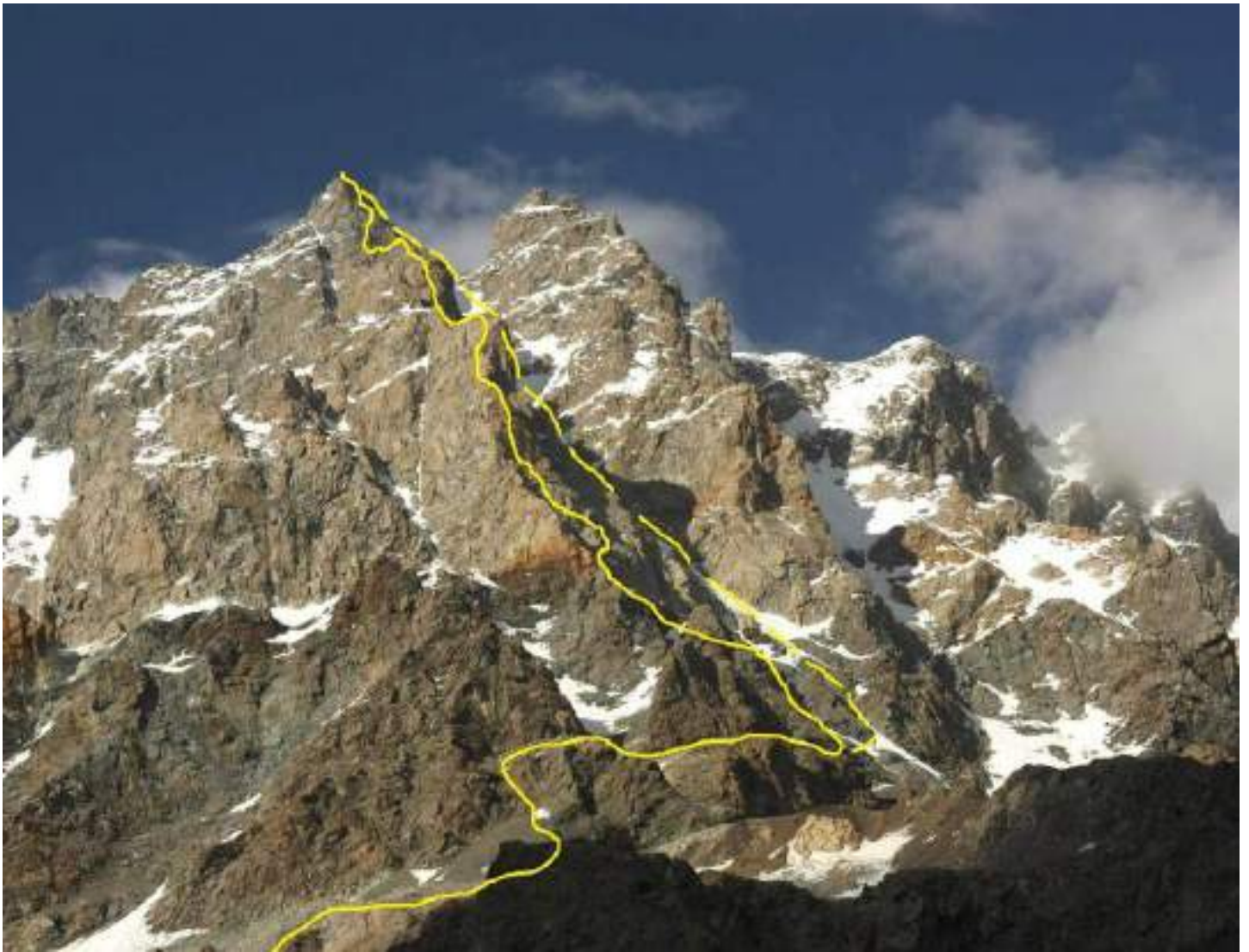
Рис. 3: Путь подъема на вершину и спуска по Южному кулуару

На рисунке 6 представлена топографическая карта района. Зеленым отмечен путь подхода под маршрут, красным — путь подъема, а синим — путь спуска команды. Нужно сразу отметить, что нитка спуска с вершины не проходит через “русские ночевки”, поскольку решение о спуске через северный гребень было принято во время восхождения, а команда не имела на руках описания соответствующего маршрута 4Б. Спуск от ночевки ВЦСПС был осуществлен оригинальным образом (ориентируясь по рельефу на месте) правее классического пути спуска.