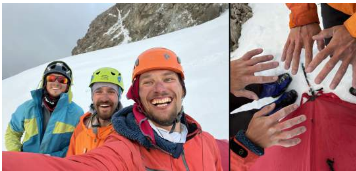
Рис. 12: Команда на ночевках ВЦСПС после достижения вершины