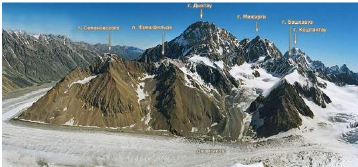
Рис. 1: Фотография района. Вид с Безенгийской стены