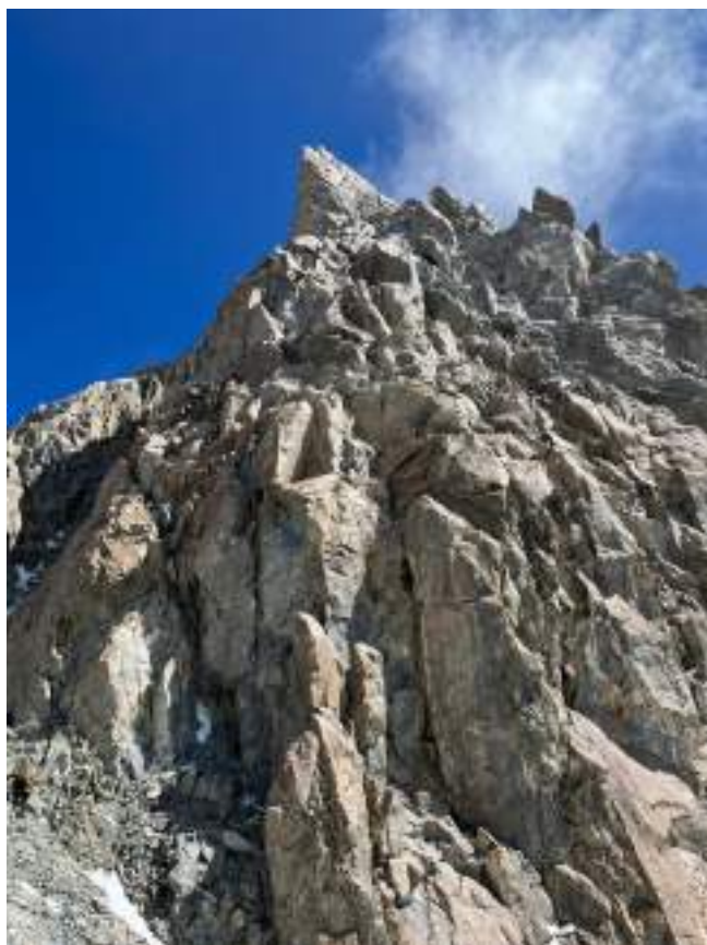
Рис. 10: Вид на верхнюю часть маршрута