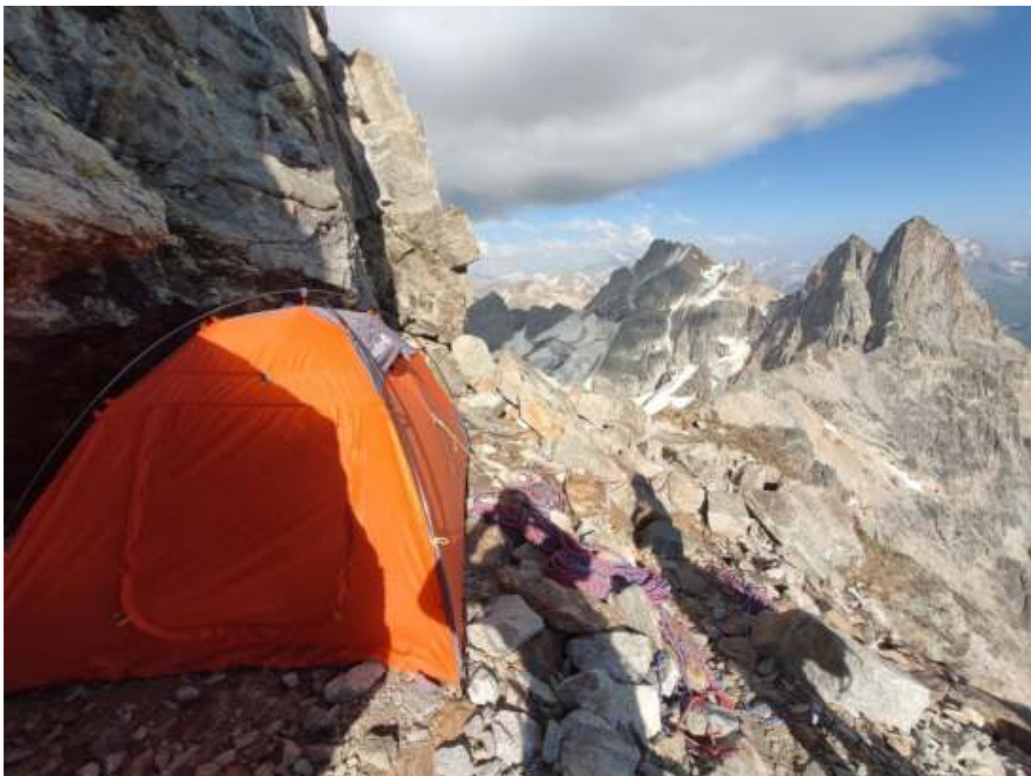
Фото 10. R10-R11. Место бивака на большой осыпной полке под вершинной башней.