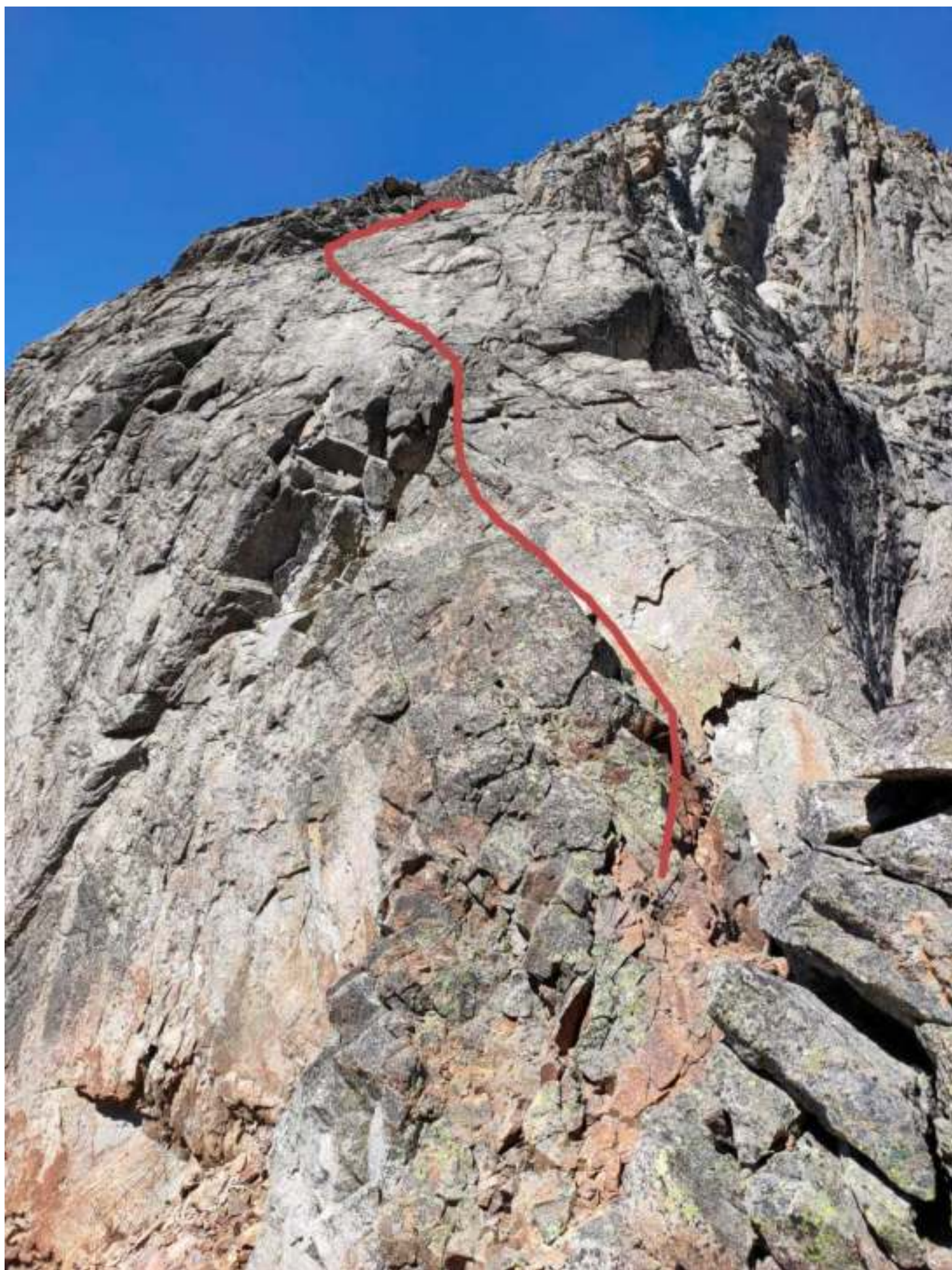
Фото 4. R2-R3. Линия движения с перевала.