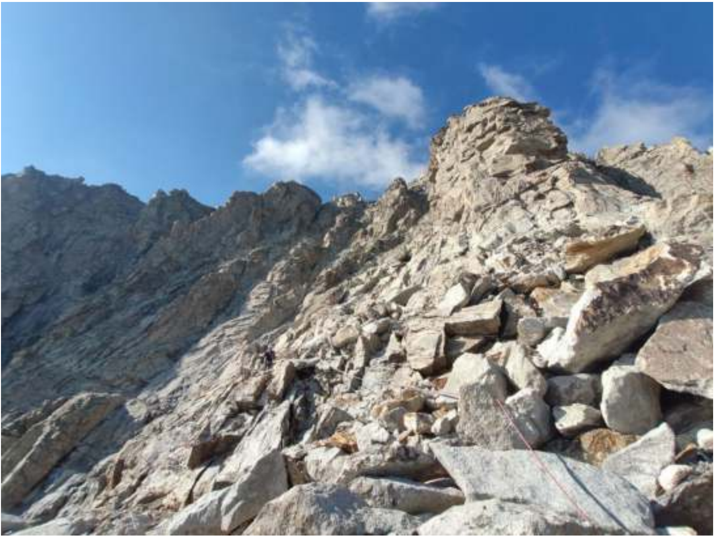
Фото 12. R11-R12. Начало движения вверх с большой полки вдоль южного ребра.