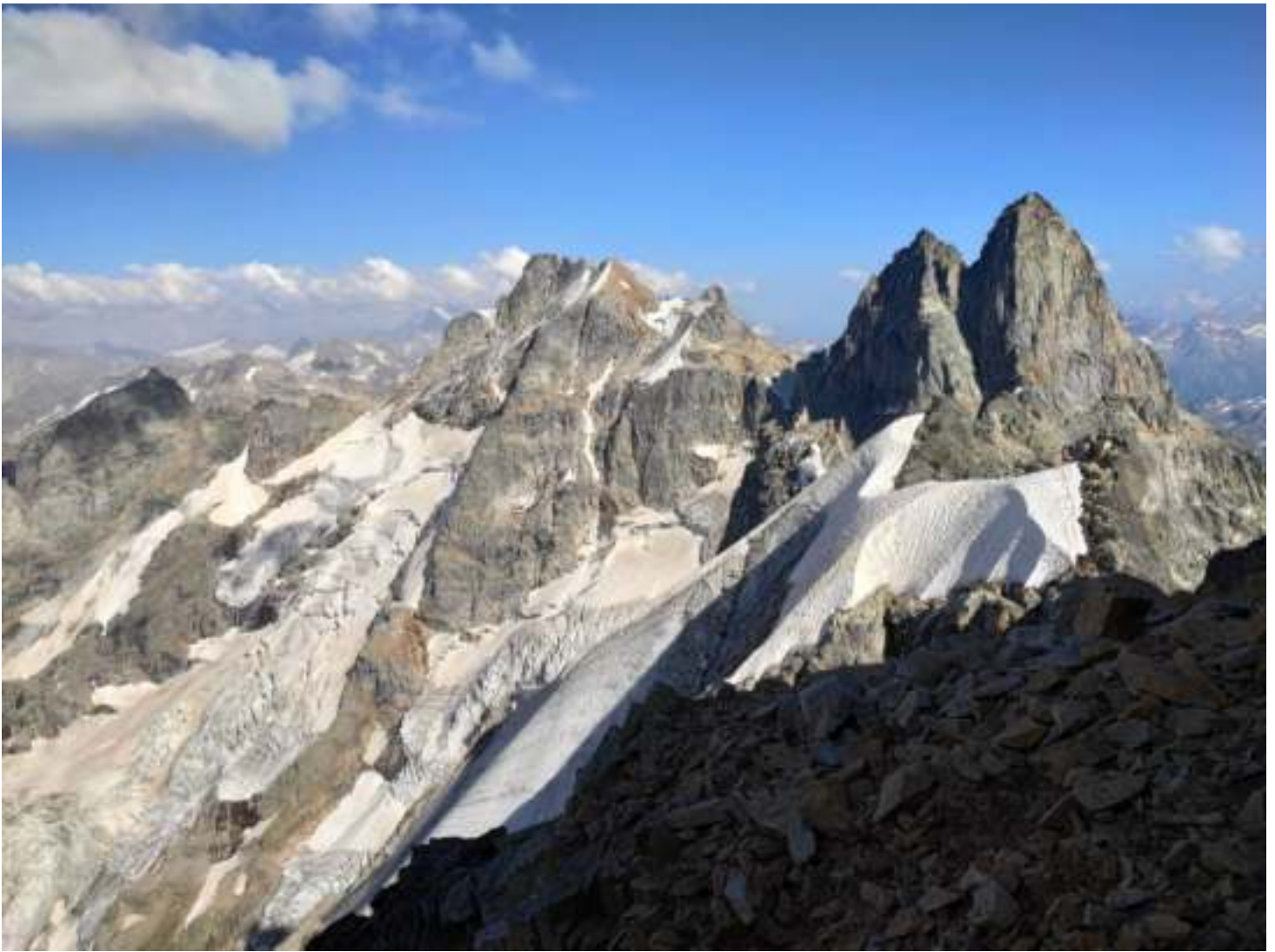
Фото 9. R7-R8. Замок, Двойняшка, снежный нож и последующий за ним участок восточного гребня Далара.