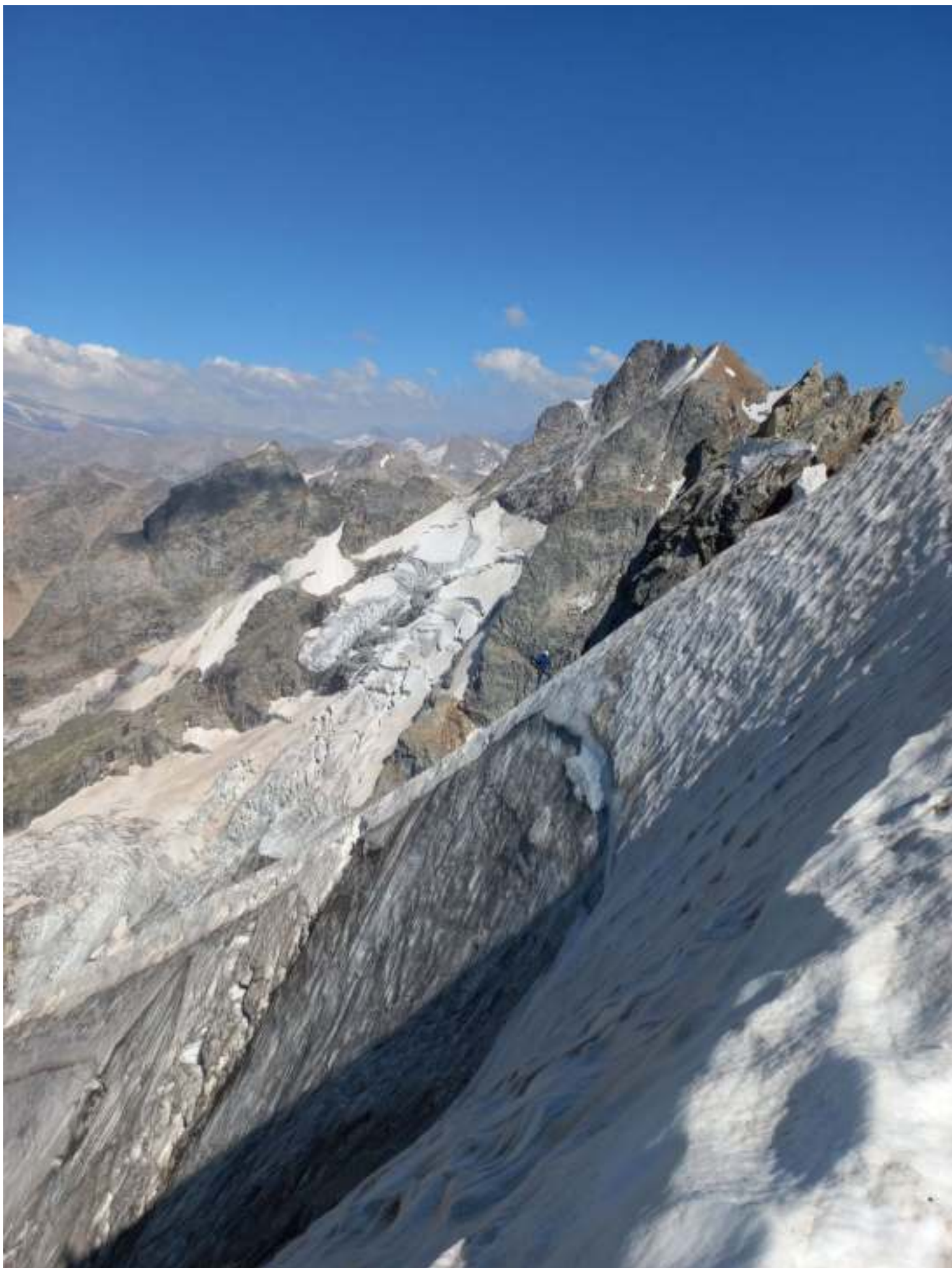
Фото 8. R6-R7. Вид назад (на восток) на снежный нож.