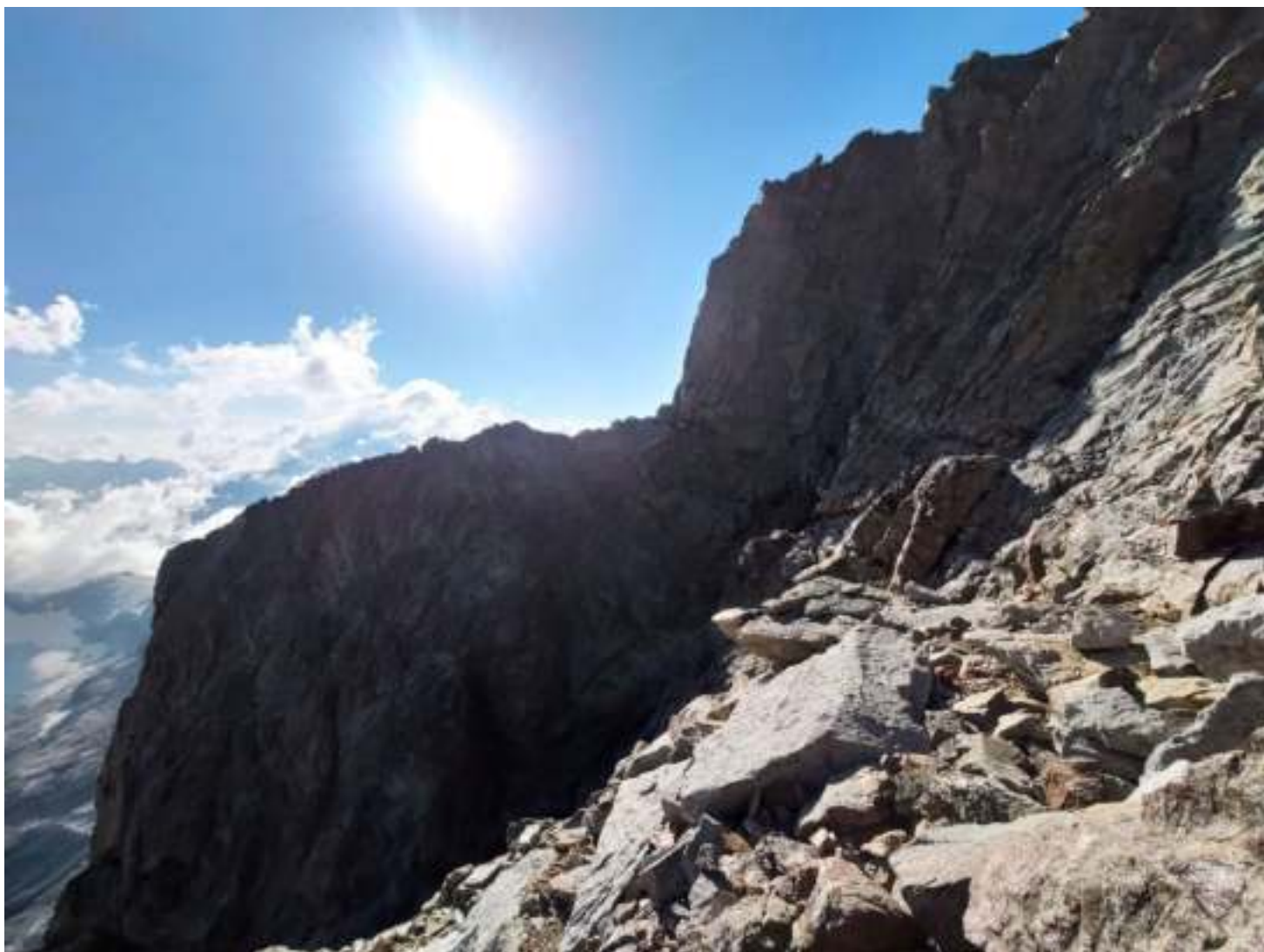
Фото 11. R10-R11. Характерный провал, полка забирает немного вниз, здесь мы начали подъем на вершинную башню