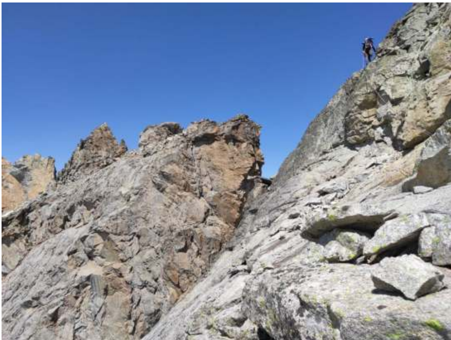
Фото 6. R5-R6. Простой гребень.