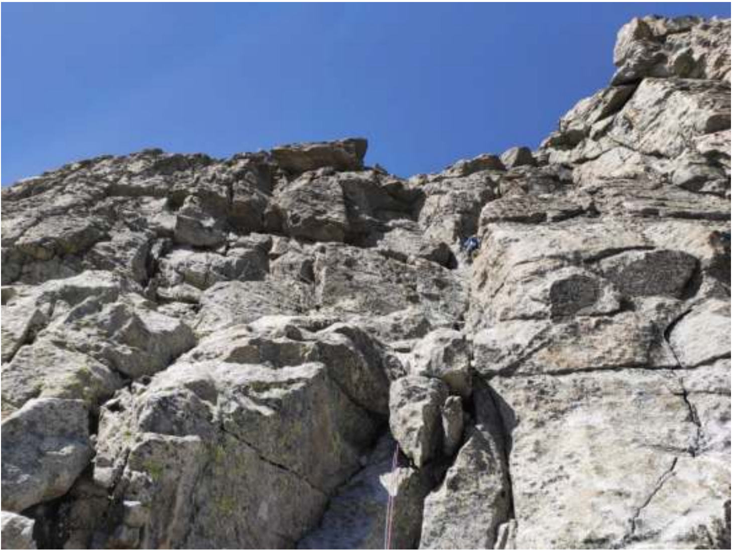
Φοτο 5. R4-R5.