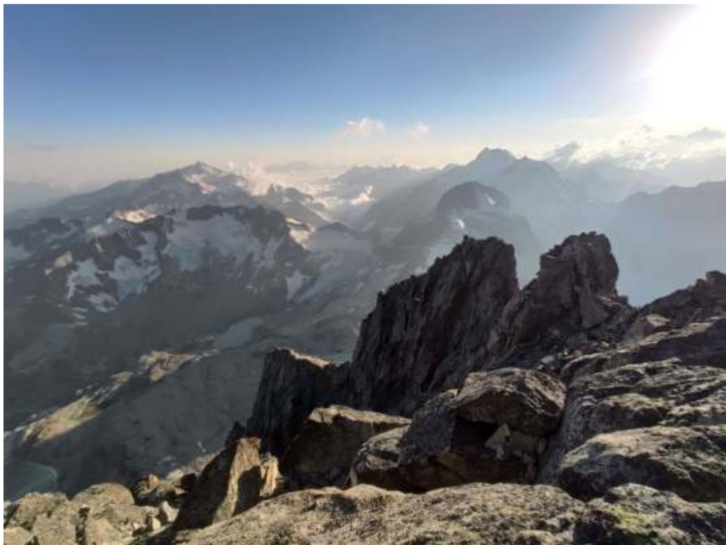
Фото 13. Вид с вершины на юго-запад.