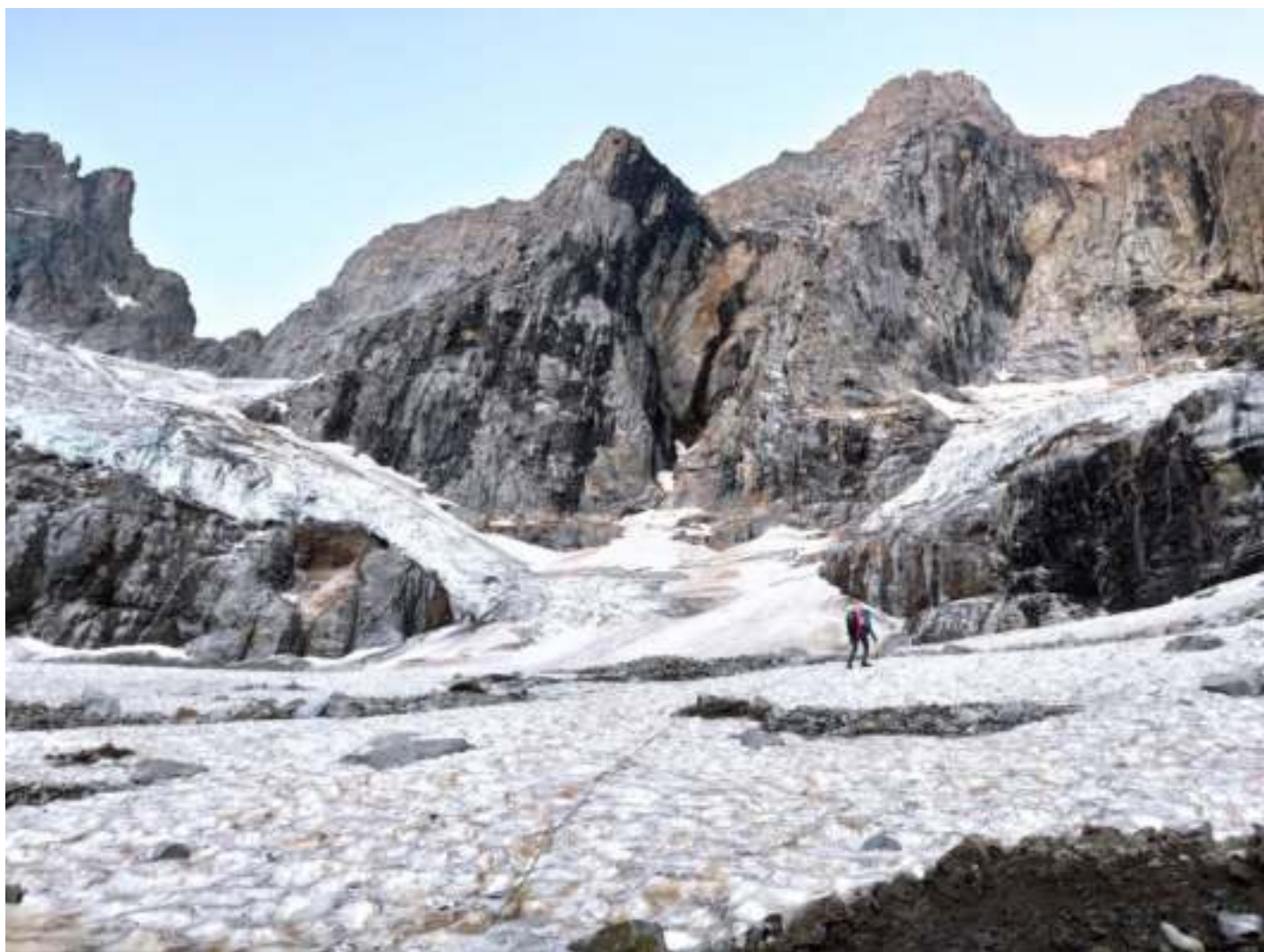
Фото 1. R0-R1. Начало движения по леднику. Траверс влево под стеной с черными потеками - самый камнеопасный участок на леднике