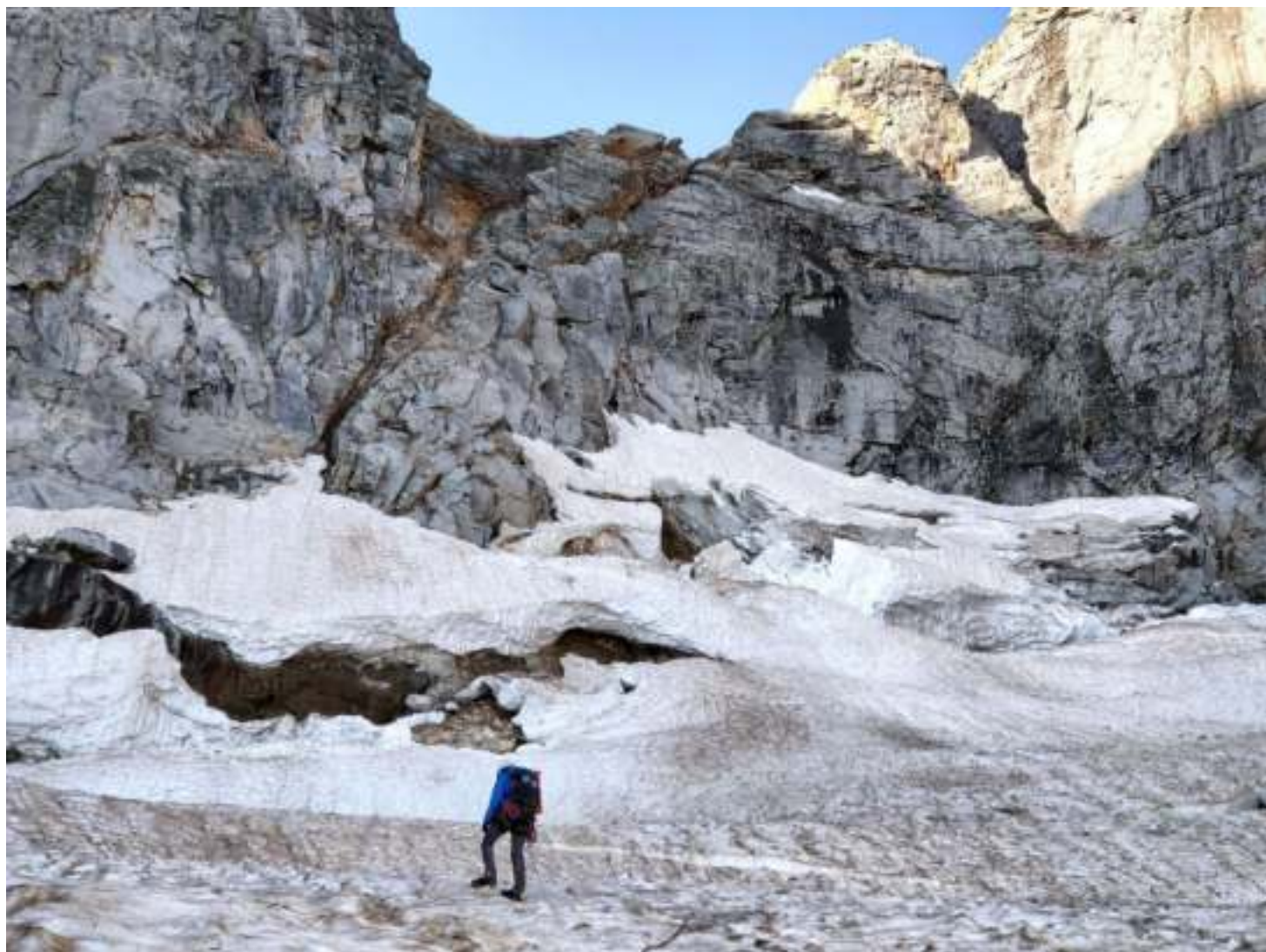
Фото 2. R0-R1. На подходе к скальному выходу на перевал. Хорошо виден путь подъема через камин в рыжий кулуар.