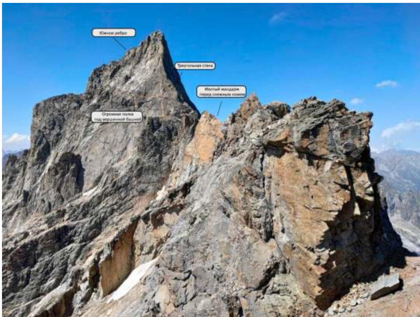
Фото 7. R5-R6. Вид на восточный гребень и вершинную башню.