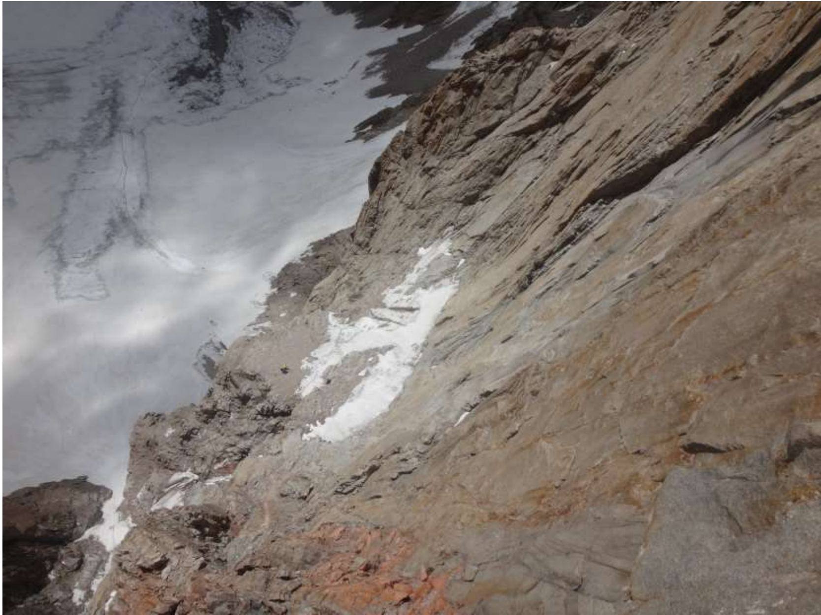
Третий участник группа на полке R 5 – первый участник на станции R 6 (фото команды Фоминых-Пильщикова с маршрута 3 ребро на Корону 5-я м-т. Ружевского)