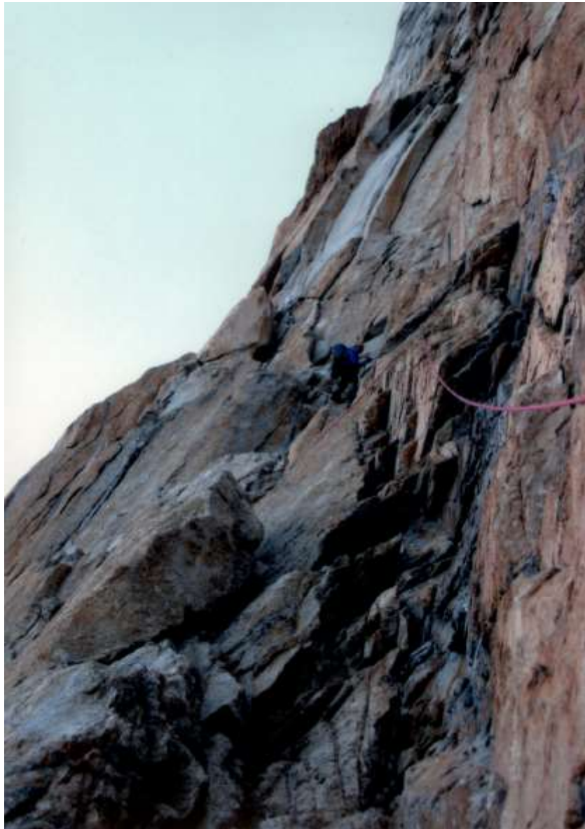
R 7 – R 8