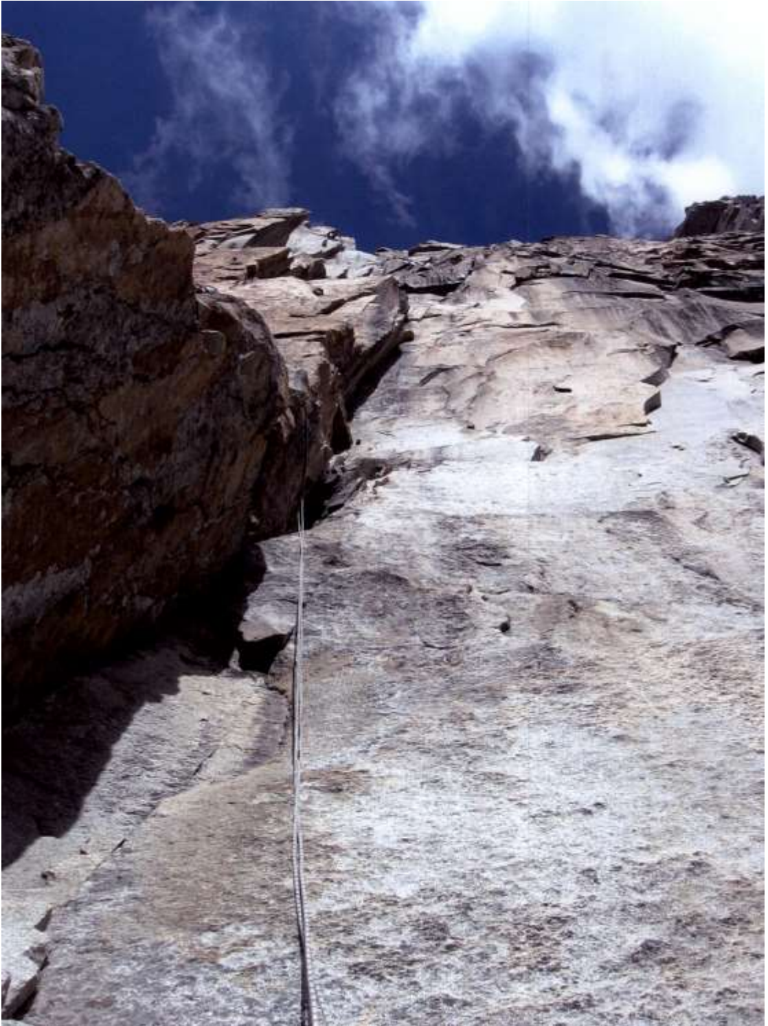
R 7 – R 8