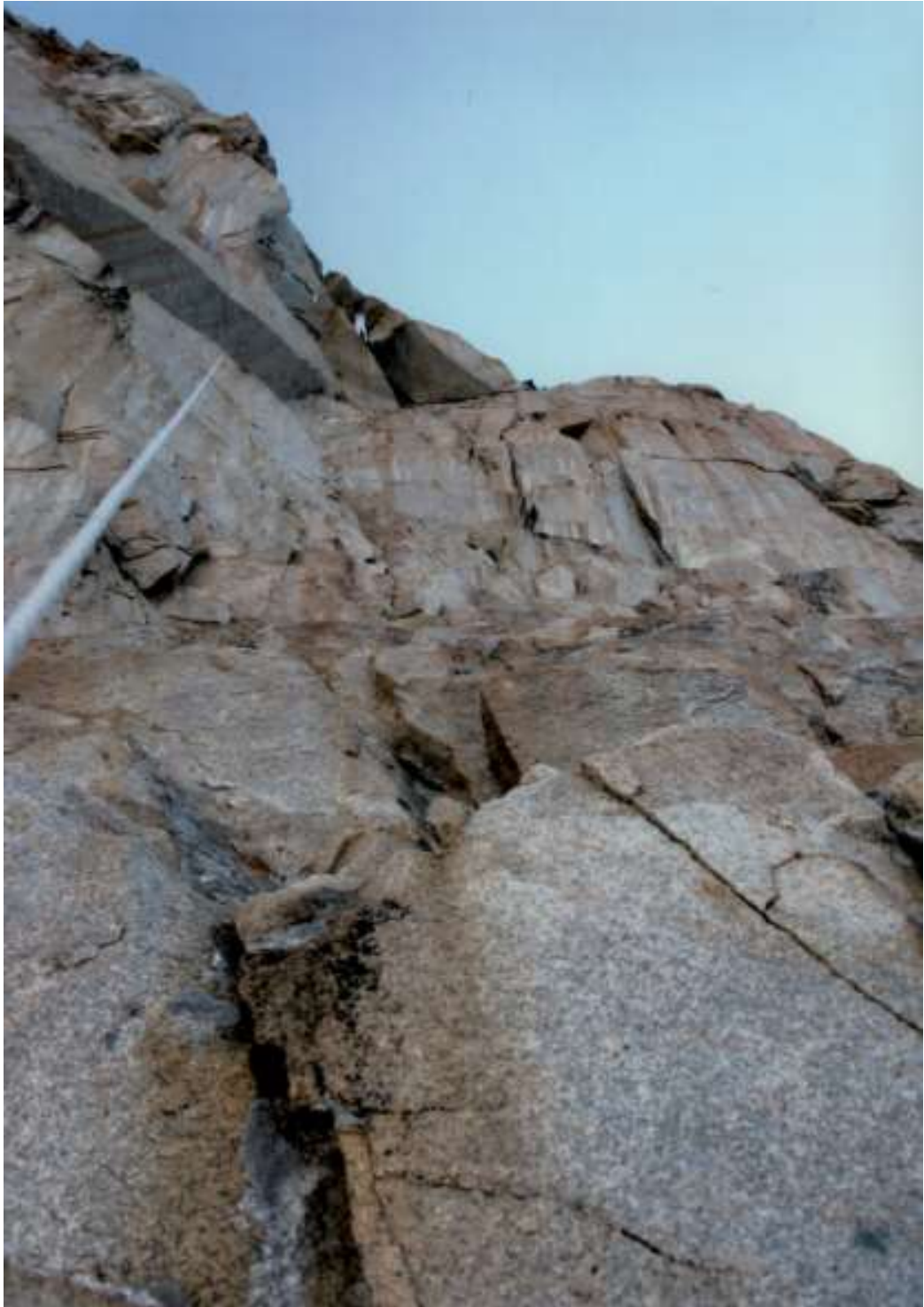
R 11 -R 12