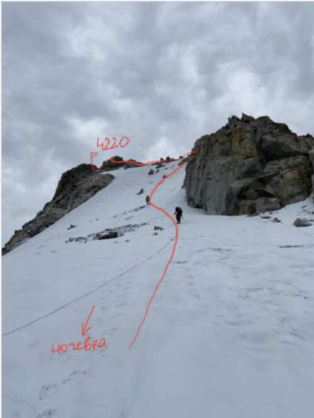
2.2. Номера участков на технической фотографии соответствуют номерам участков на схеме маршрута в символах УИАА