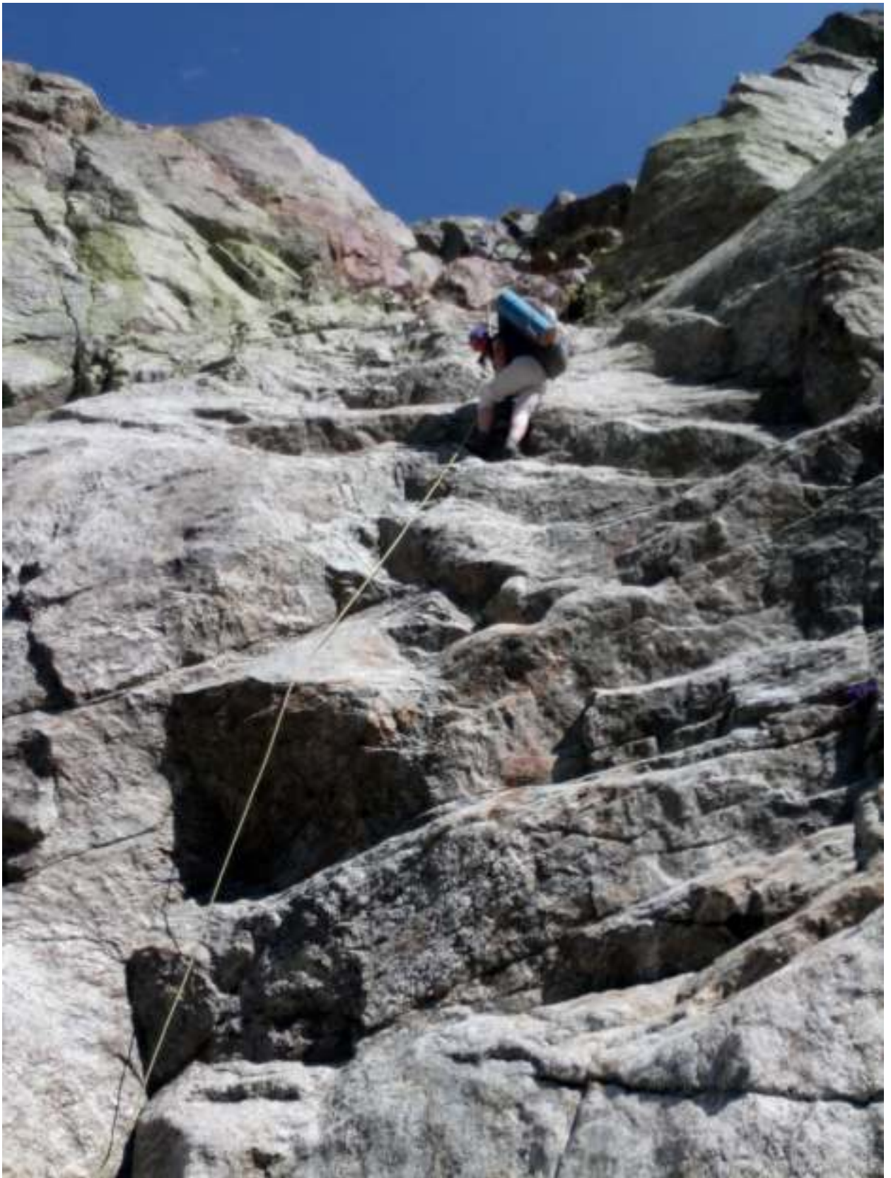
Окончание морены - Скальная стенка с веревкой. 20.08.2022