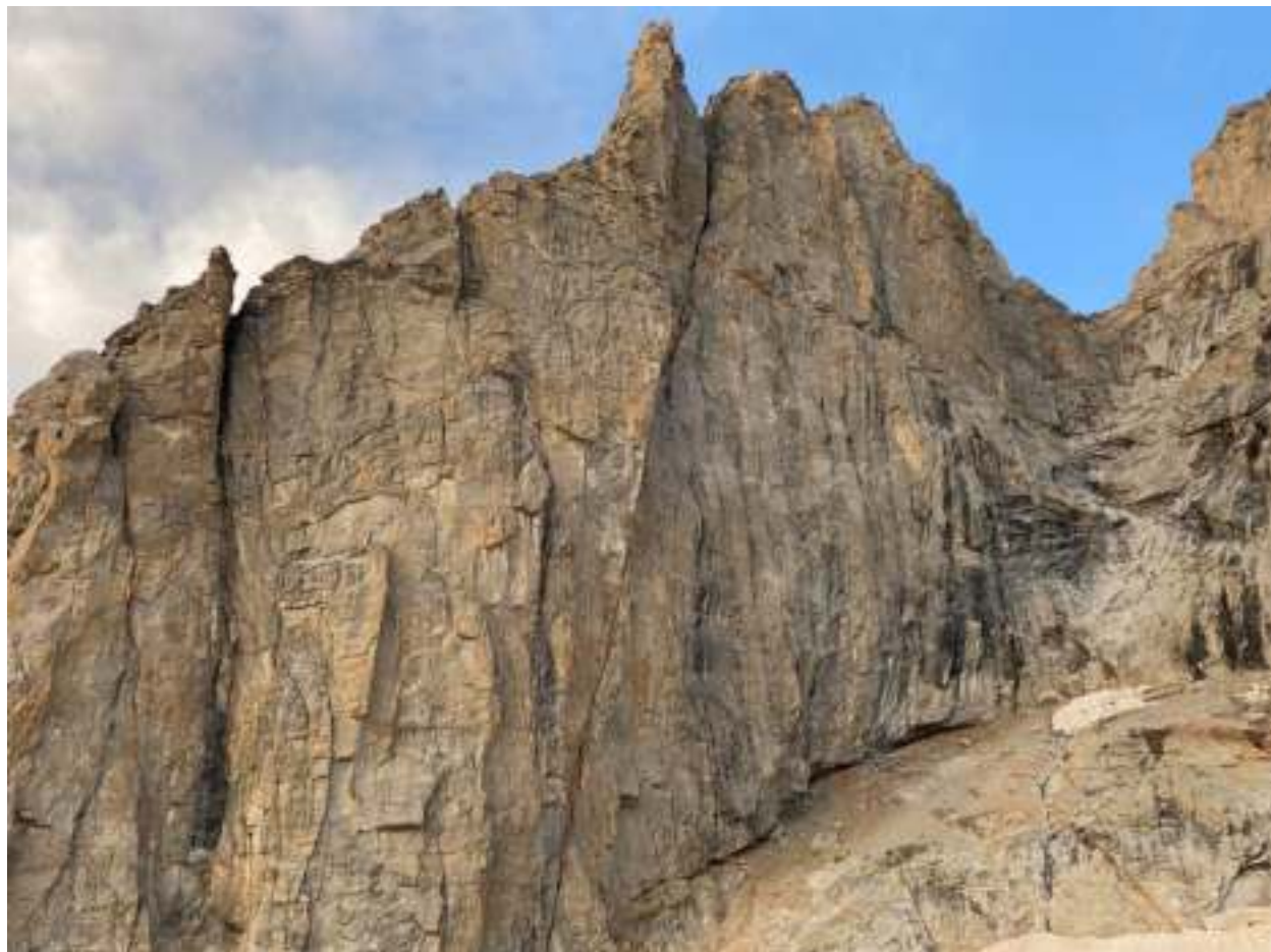
Общее фото стены п. Шоколадный, сделанное с ледника 20.08.2022.