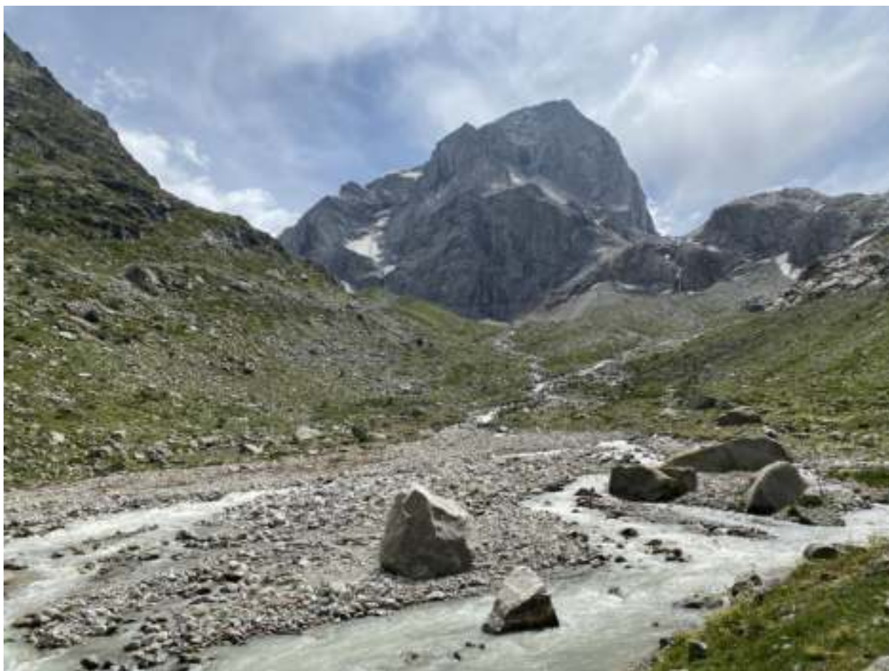
Место перехода реки в брод. 20.08.2022

Дальше по курумнику придерживаясь туриков выйти на ночевки. Есть несколько мест для обустройства бивуака, нам самым оптимальным показалось место максимально близкое к стене, там обустроены площадки для палаток на морене, есть вода с ледника.