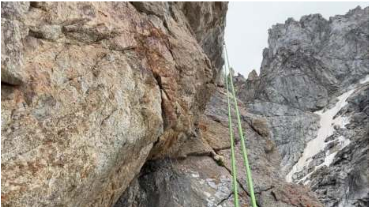
Участок R10 – траверс через «живую» пробку