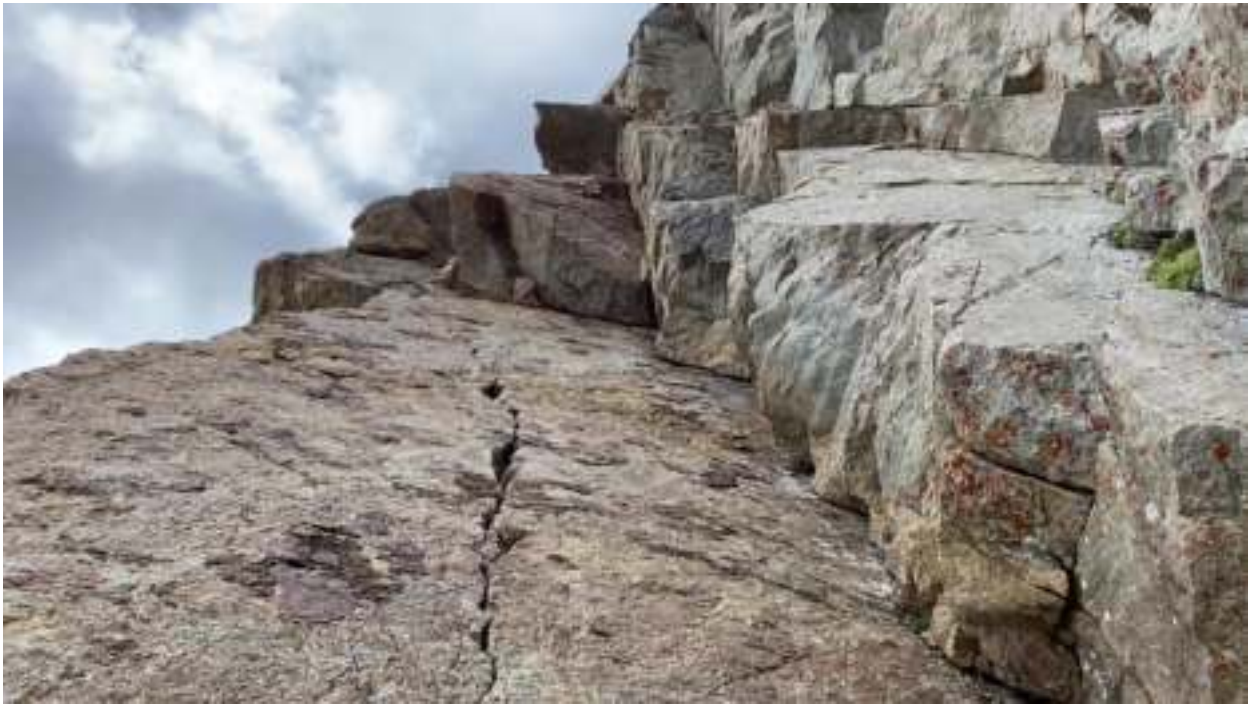
Участок R11. Наша команда лезла по трещине в начале ИТО дальше лазанием, где щель расширяется.