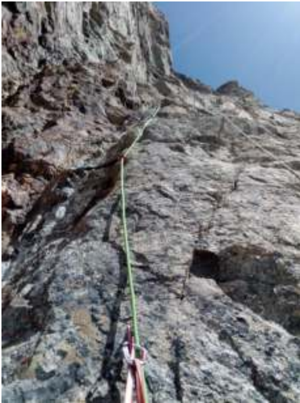
Участок R6 – Лазание по разрушенному рельефу промоины