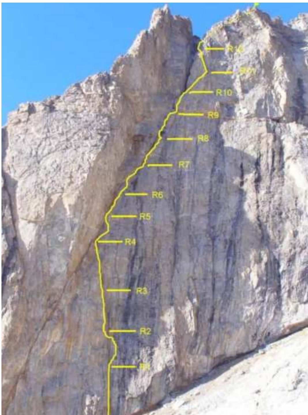
Нитка маршрута с указанием станций