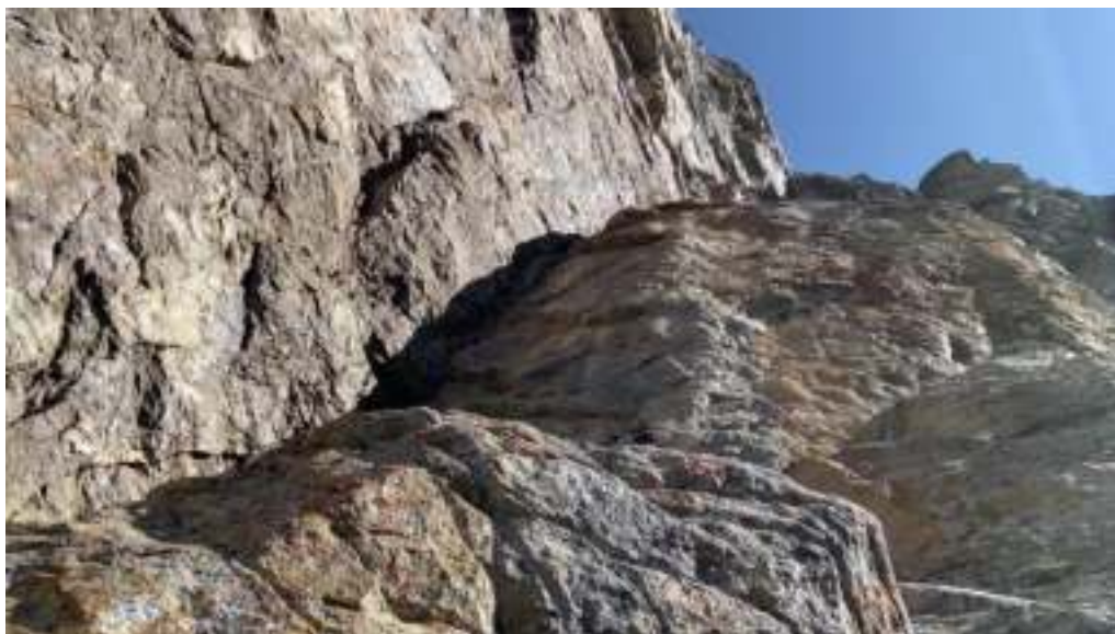
Участок R5 – обход разрушенного угла справа