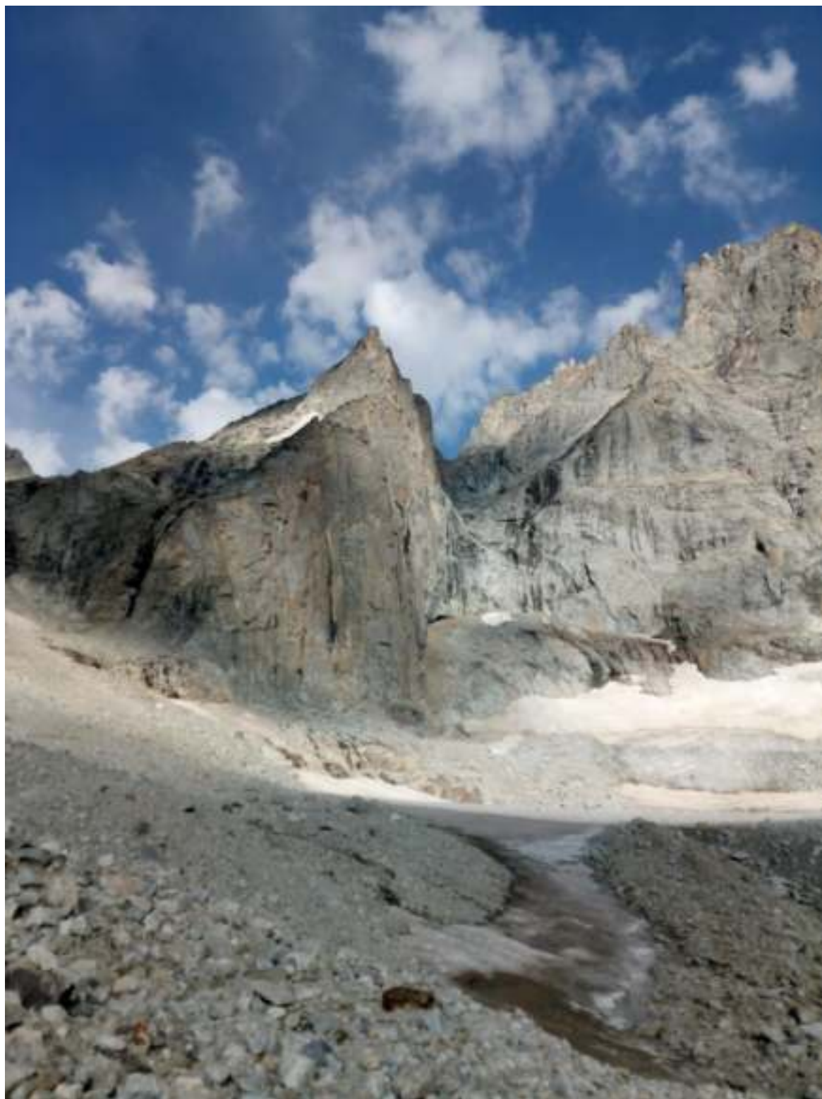
Фото сделанное с ночевок 20.08.2022. Слева пик Шоколадный, справа г. Далар