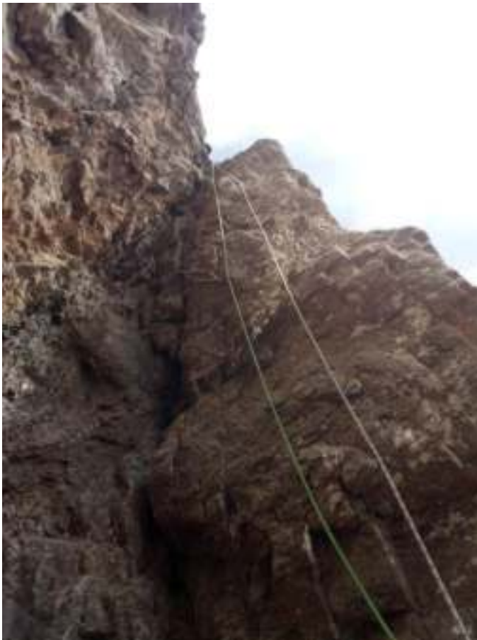
Участок R7 – Разрушенный угол/камин