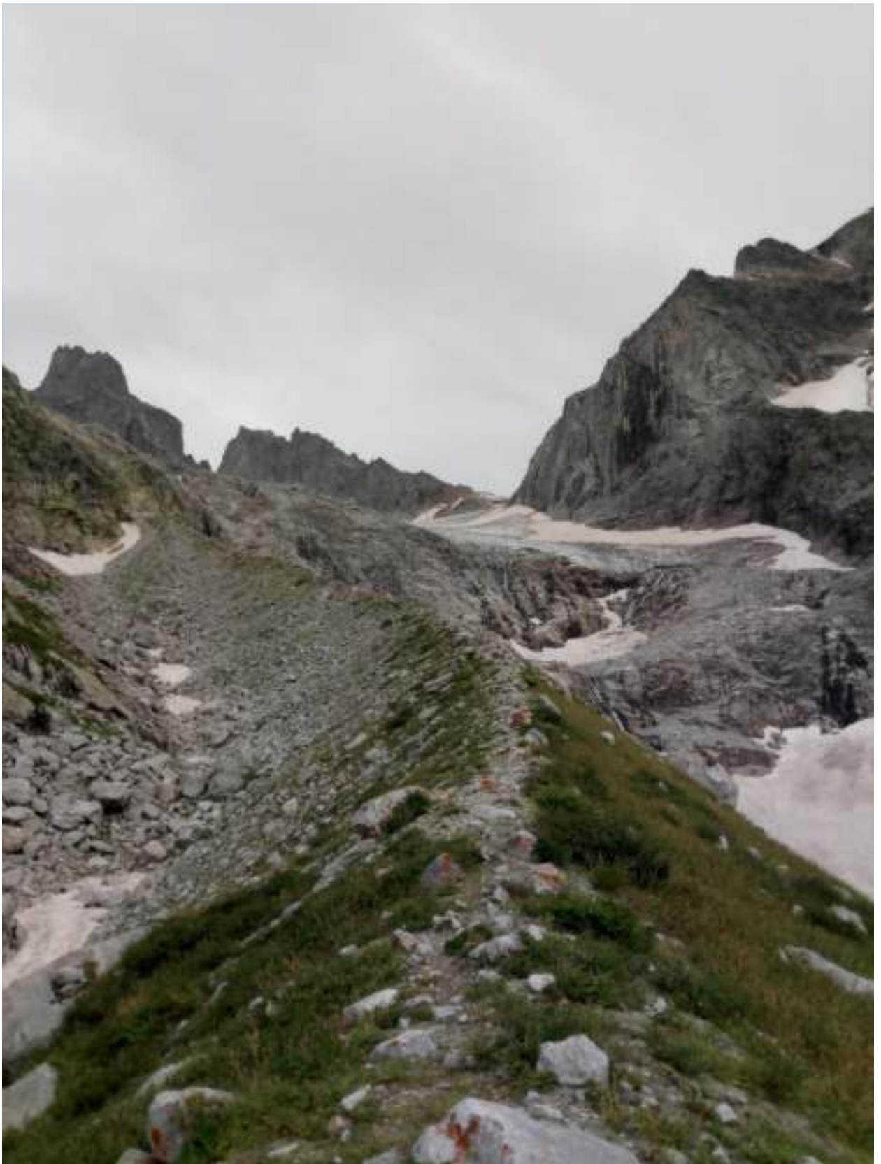
Морена. Слева виднеется г. Далар, справа г. Кирпич 20.08.2022