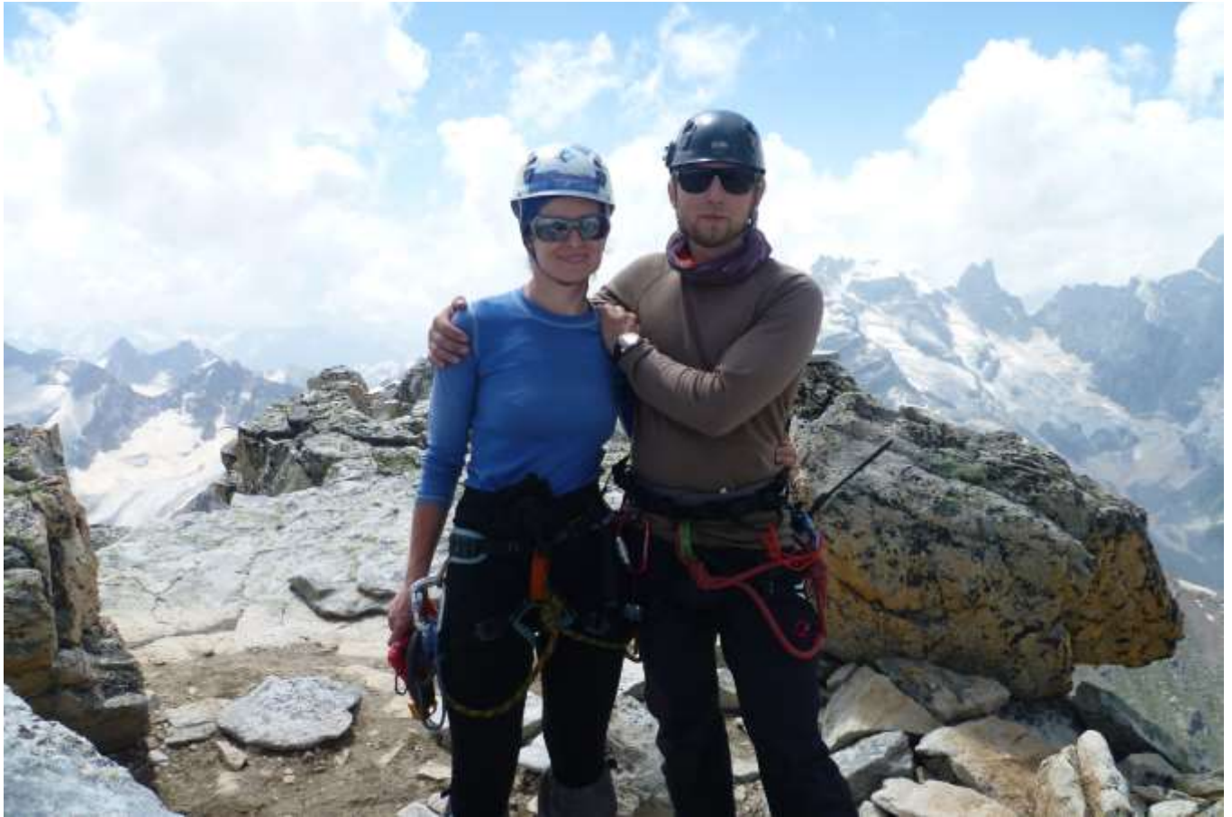
Фото на вершине