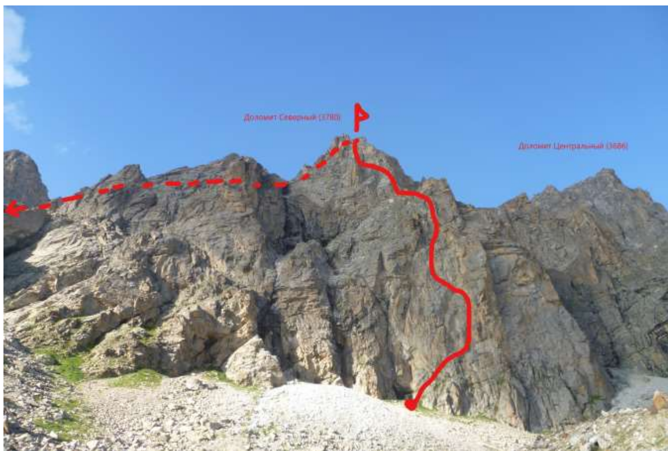
Фото вершины Доломит Северный с ночевок на Доломитских озёрах. Фото сделано 28 .07.2018