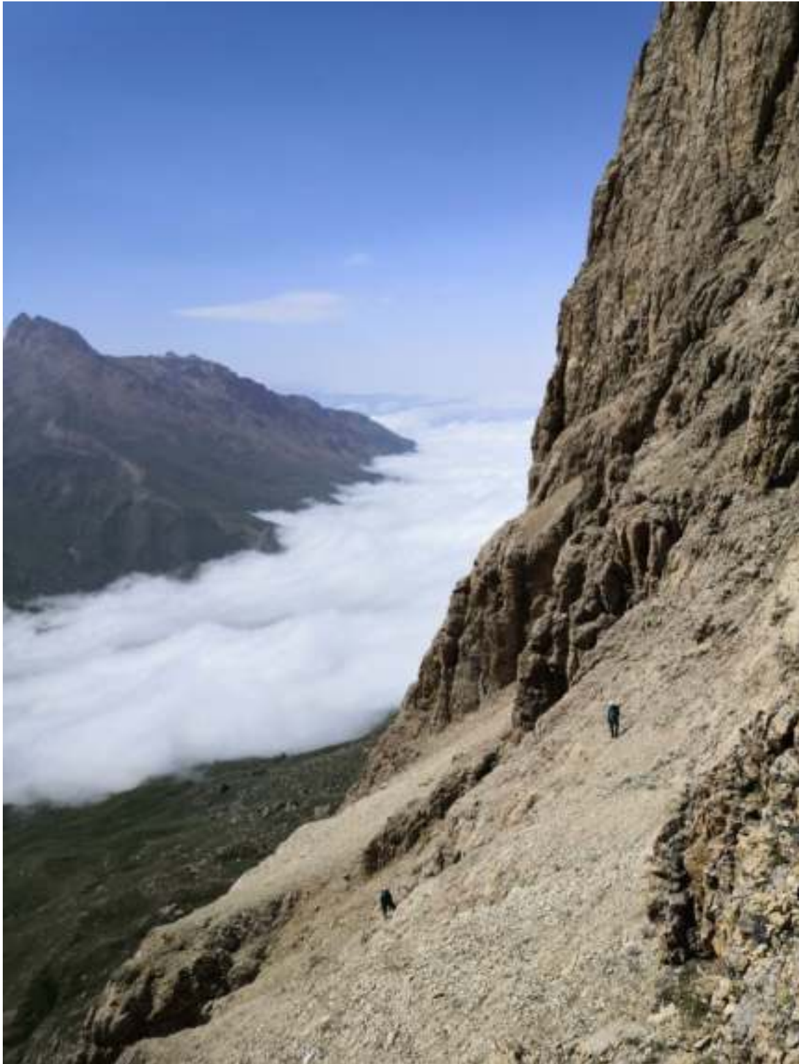
Рис. 5: Одновременное движение (на уровне бастиона)