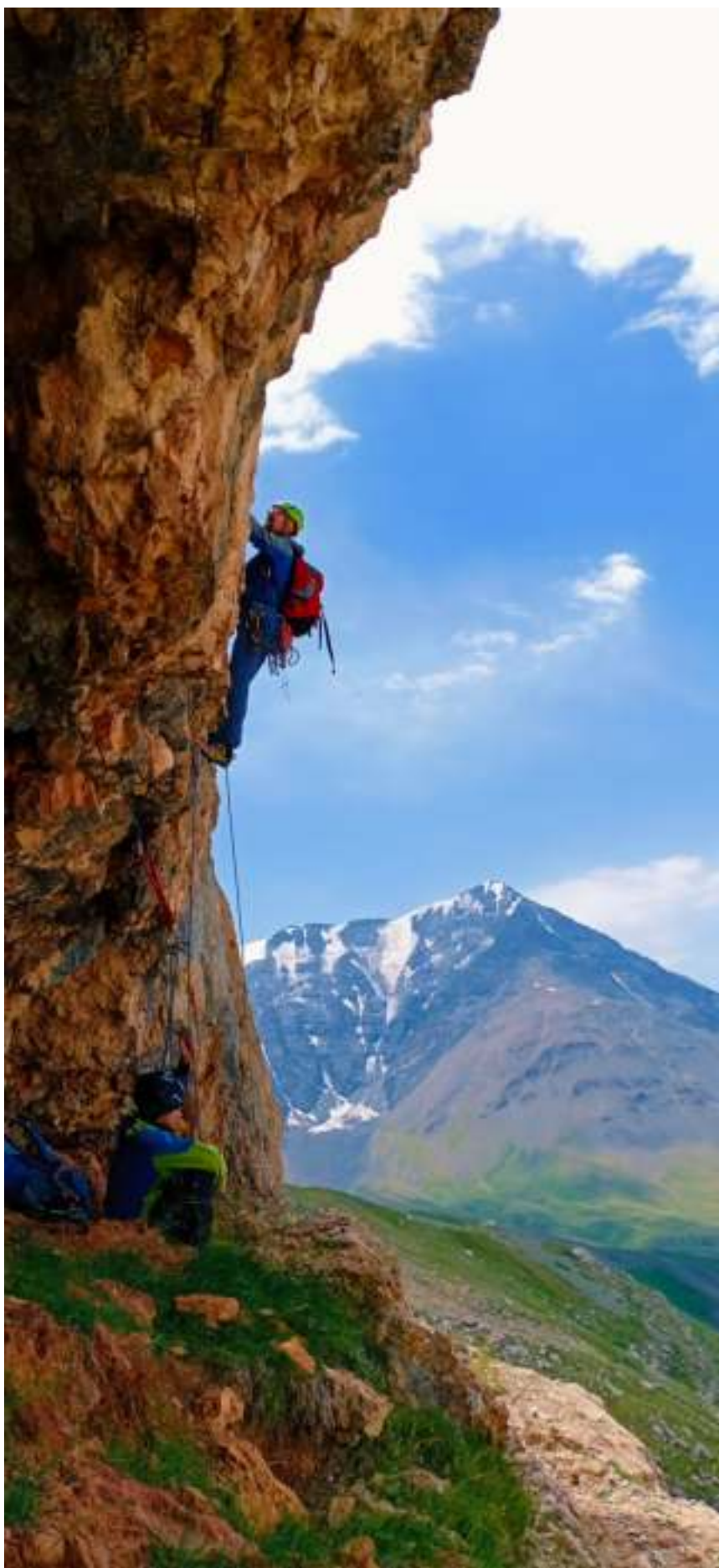
Рис. 4: Прохождение ключевого участка