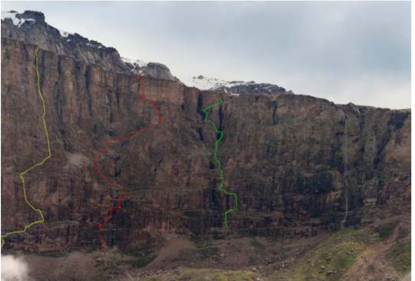
Рис. 1: Фотография маршрута. Центральная красная линия соответствует пройденному маршруту, слева желтым выделен маршрут Некрасова (5А), справа - Незаметдинова (4Б)