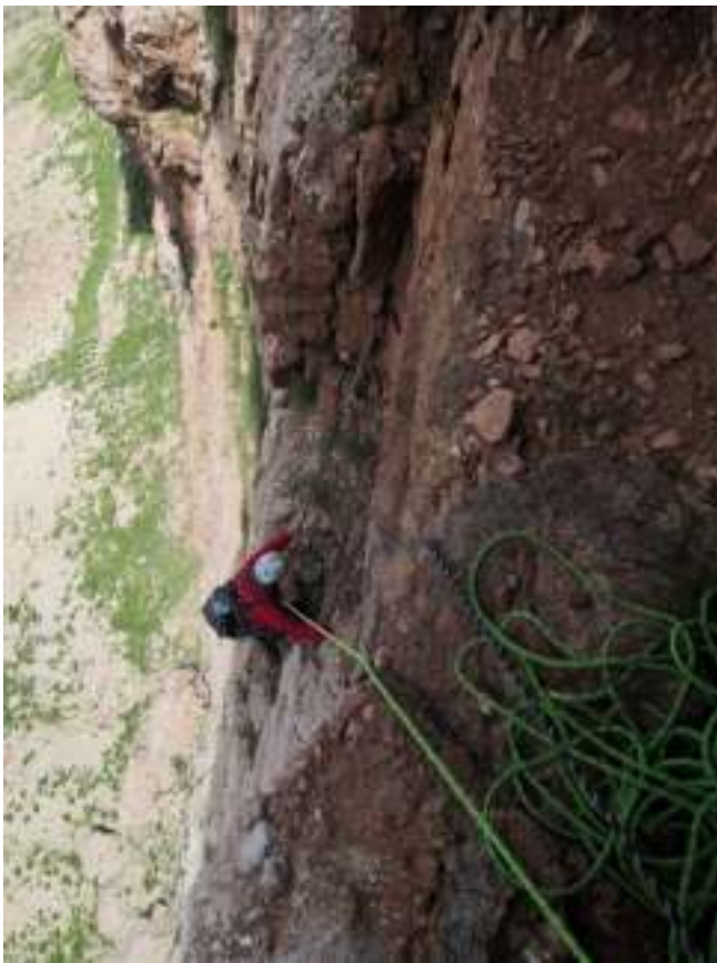
(а) Выход на полку, вид из грота