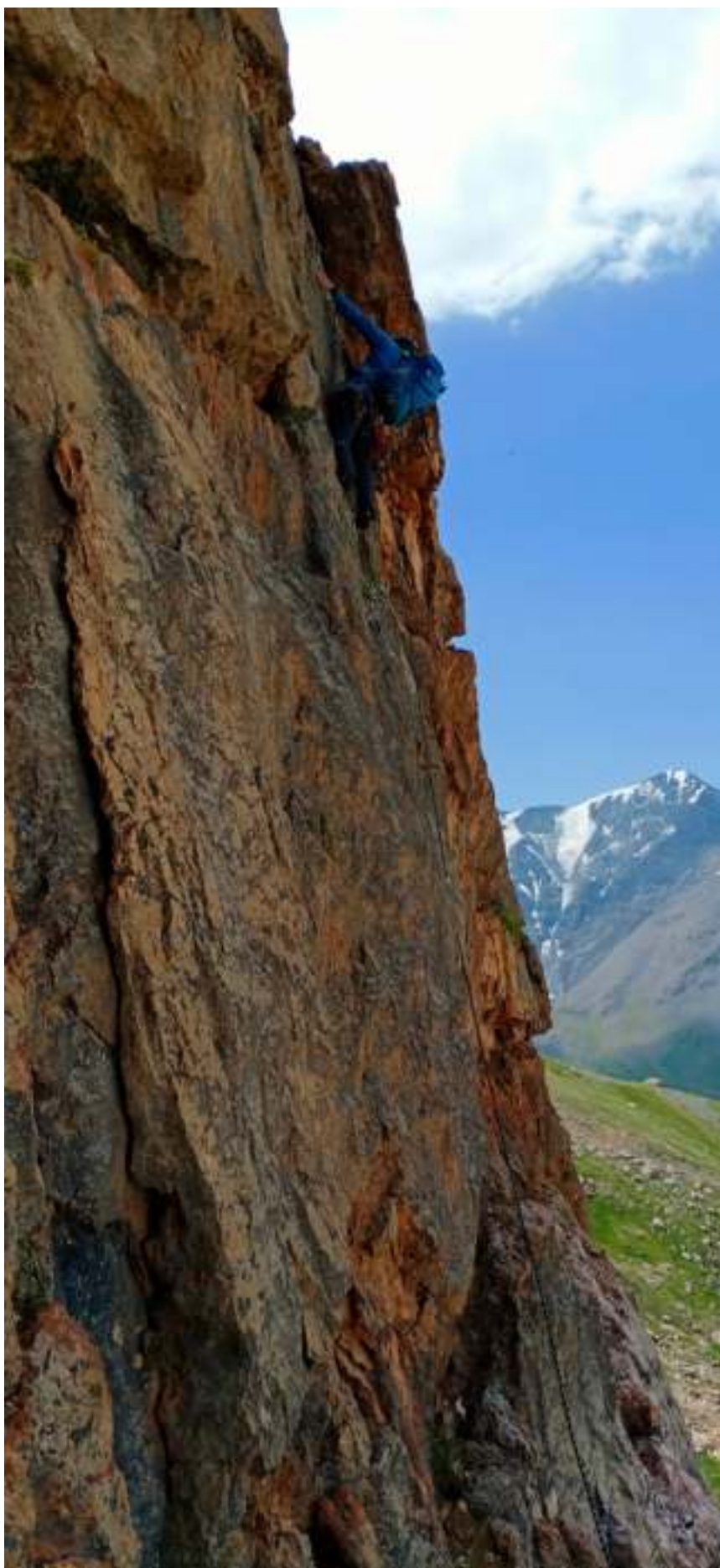
Рис. 3: Участок R1-R2, лазание перед выходом в грот