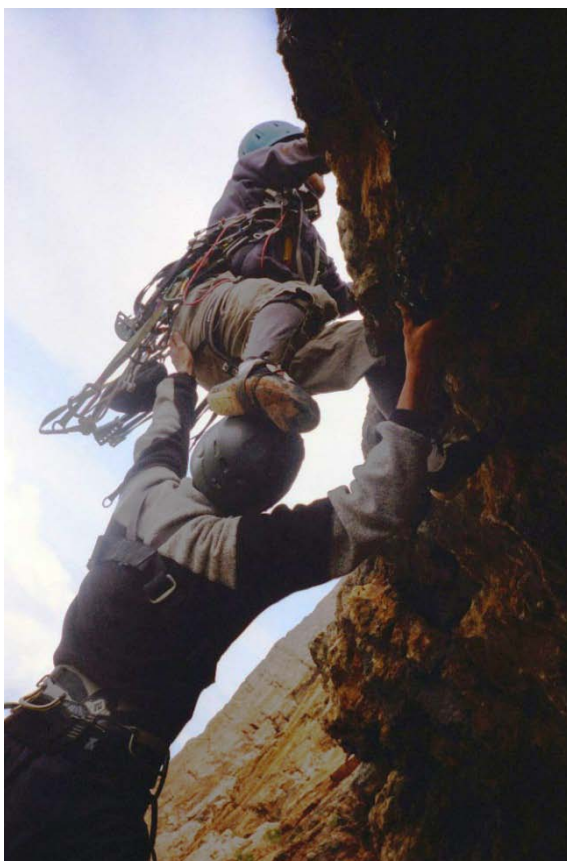
Рис. 6. Ключевой участок 3.