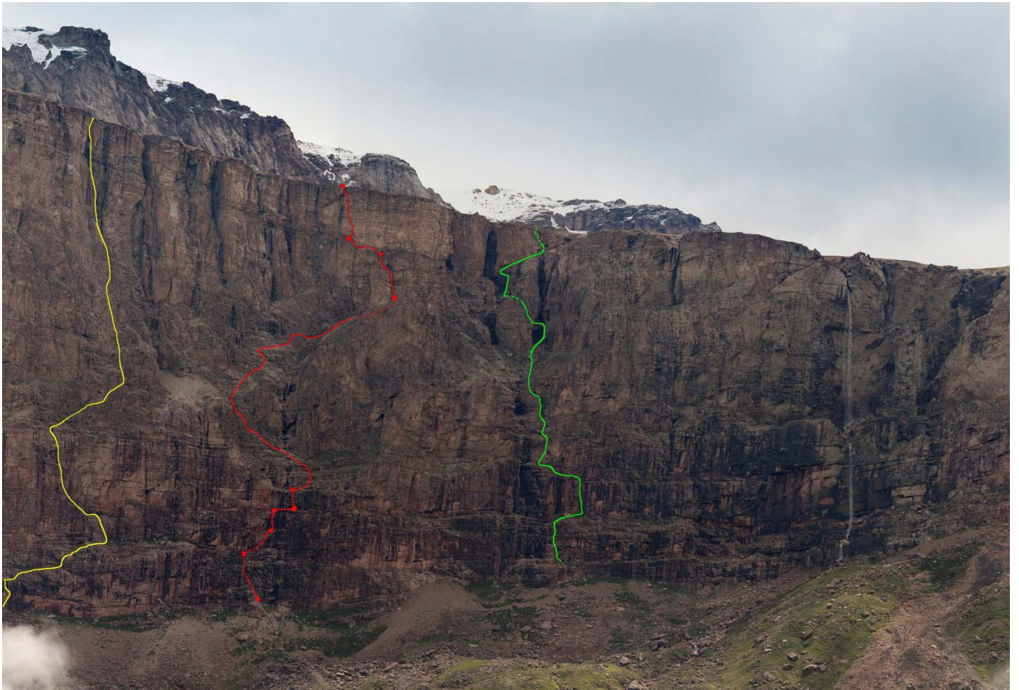
Рис. 1. Красным показана линия маршрута, пройденного командой. Желтым выделен маршрут Некрасова (5А), зеленым – Незаметдинова (4Б).