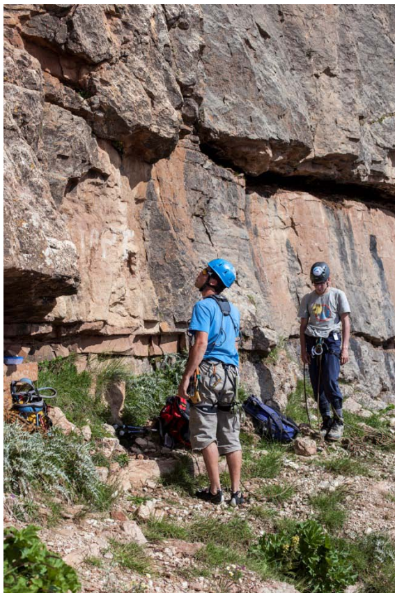
Рис. 4. Начало маршрута.