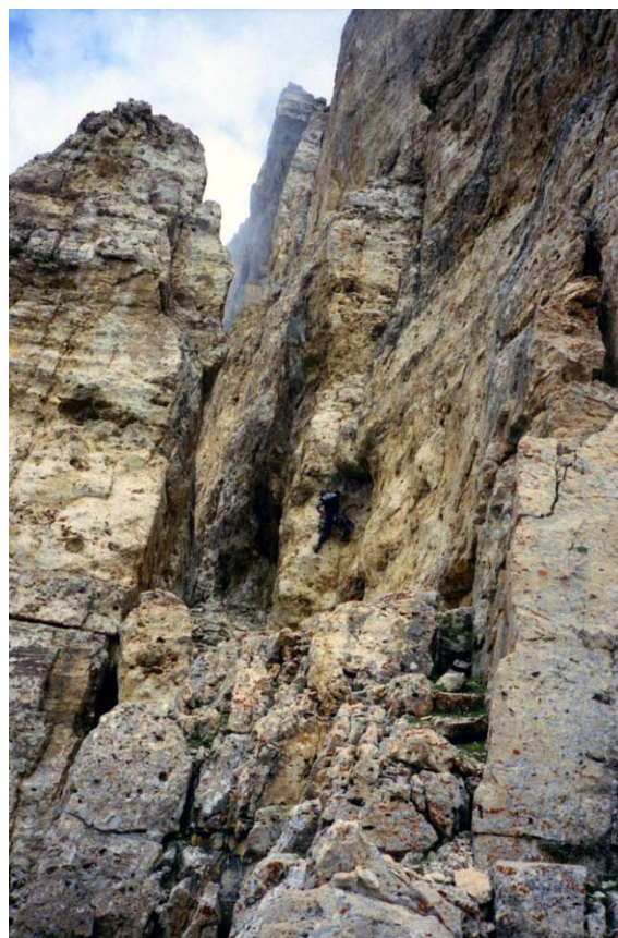
Рис. 7. Худяков на участке 7.