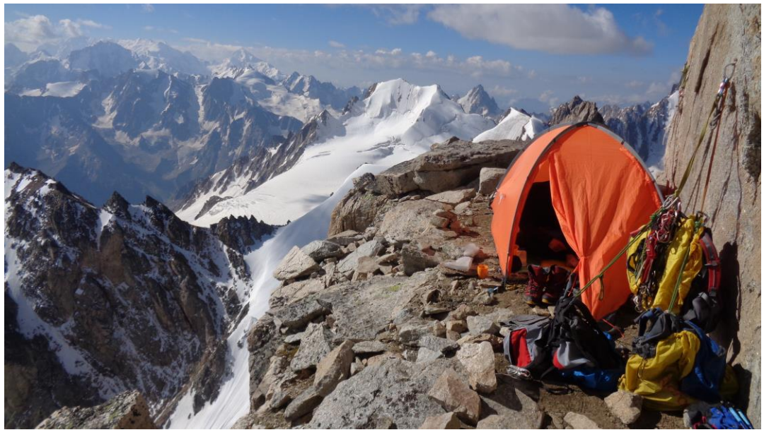
Ночевка на маршруте.