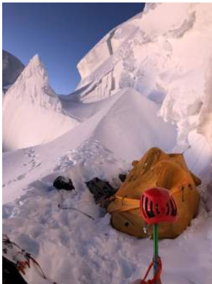
Ночевка под вершиной