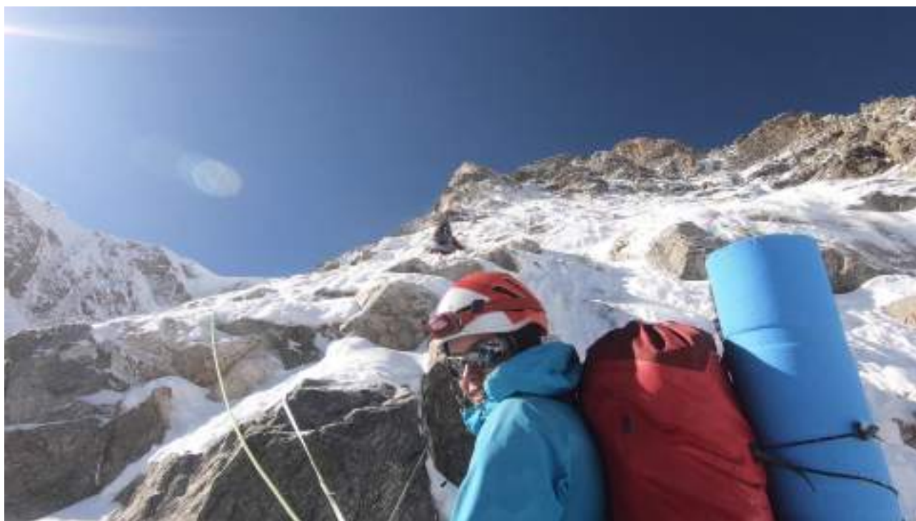
Нижняя часть маршрута