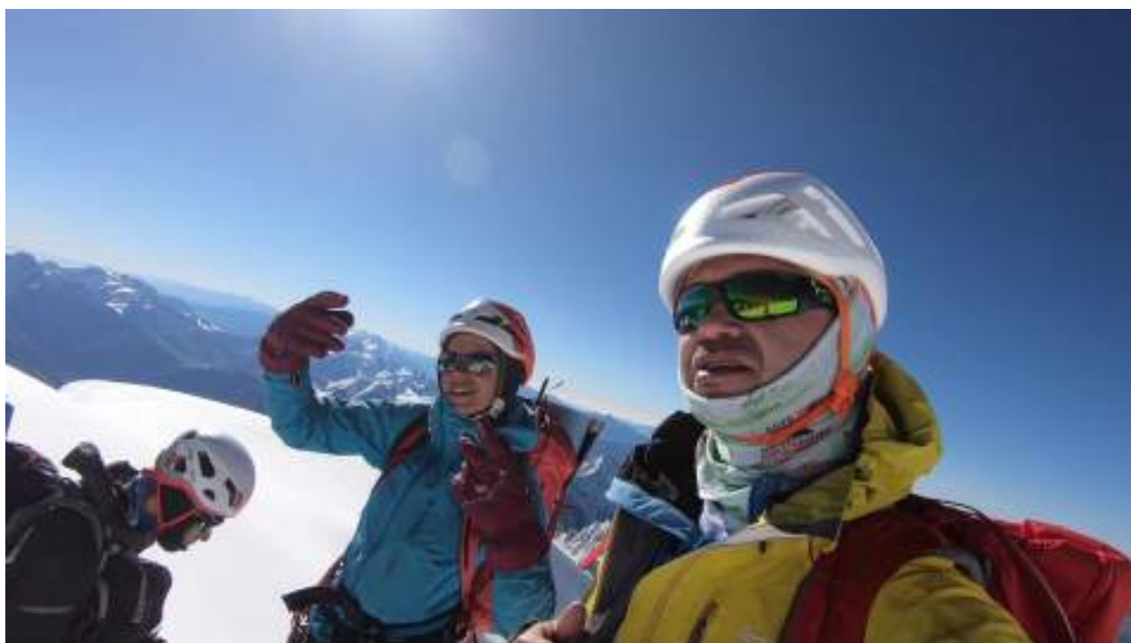
Фотография с вершины