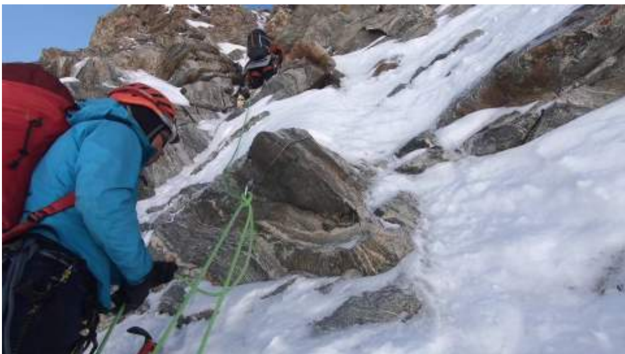
Нижняя часть маршрута