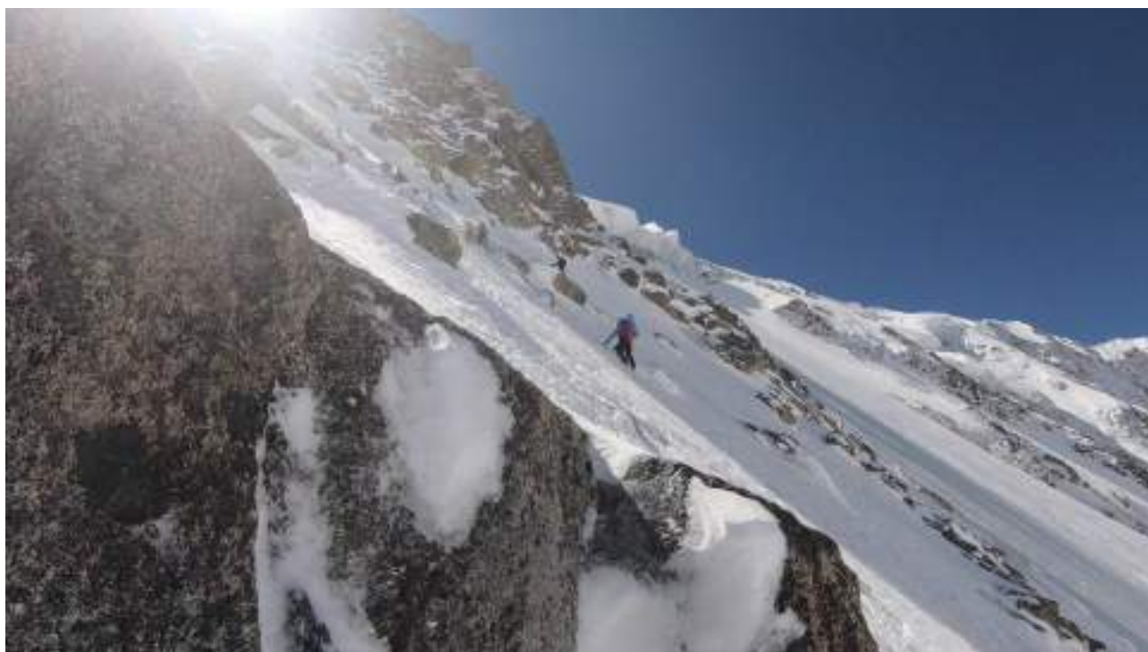
Средня часть маршрута