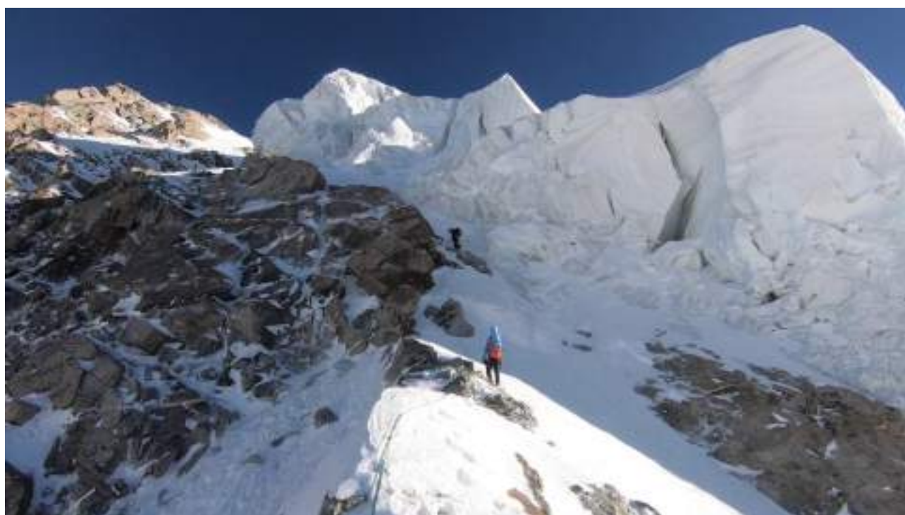
Верхняя часть маршрута