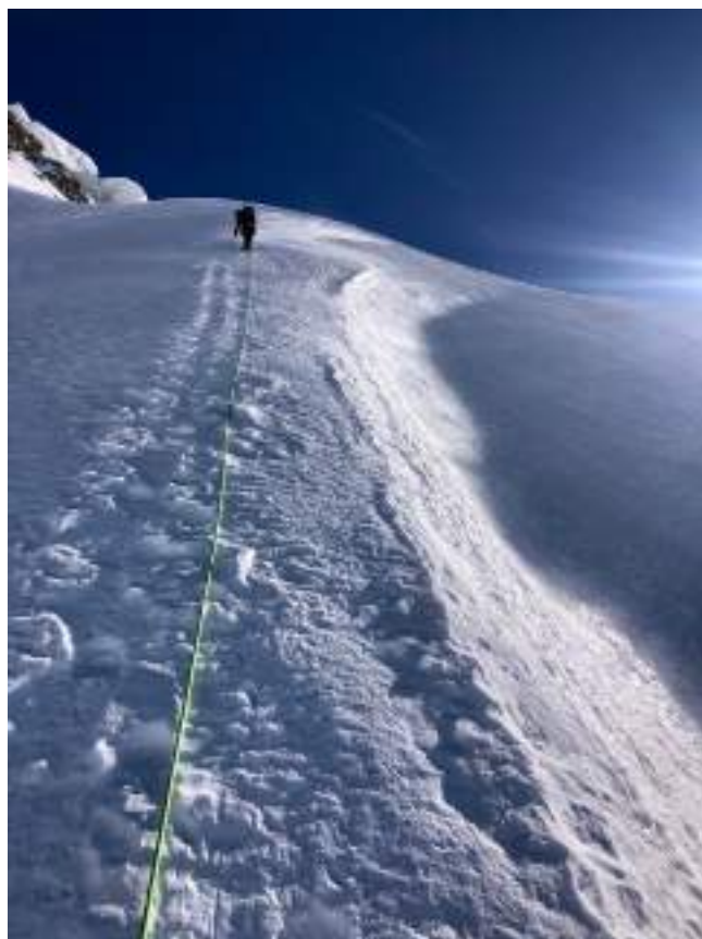
Верхняя часть маршрута