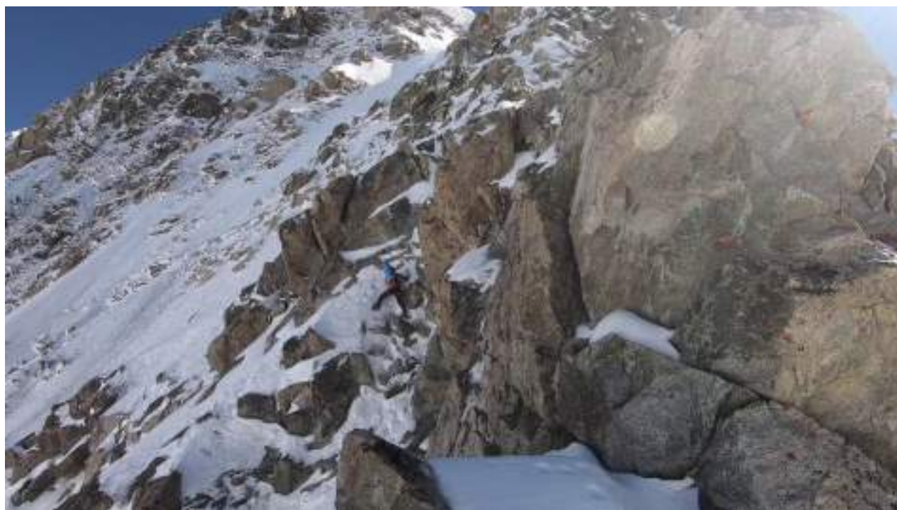
Средняя часть маршрута